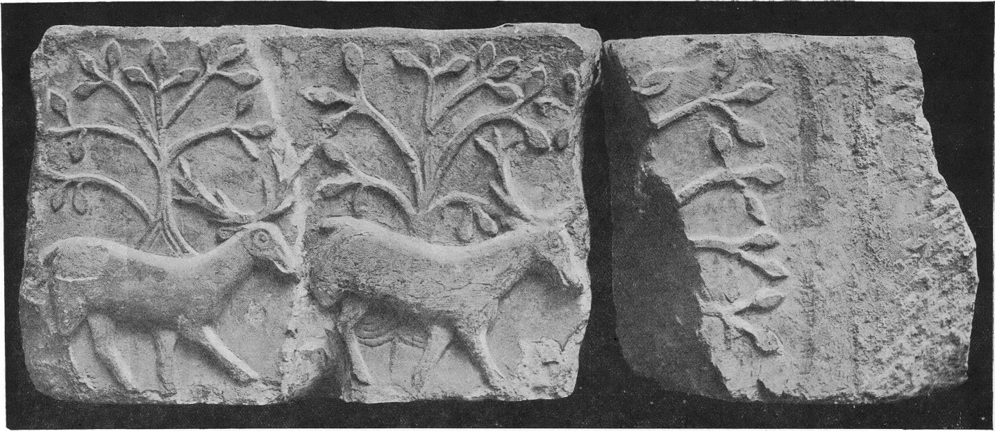
FIG. 2. — Musée de Genève. Collections lapidaires, nos 4736, 4737.