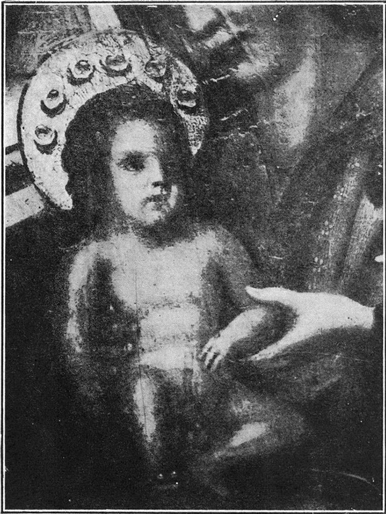
FIG. 1. — L'Adoration des Mages. L'Enfant Jésus, avant la restauration.