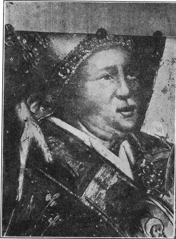
FIG. 4. — Le cardinal François de Mies avant la restauration.