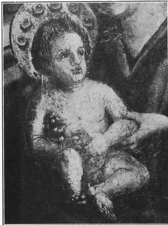
FIG. 3. — L'Enfant Jésus après la suppression des repeints et le masticage des canaux.