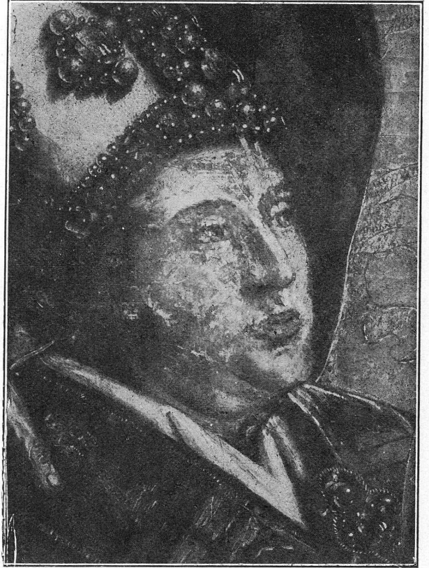
FIG. 5. — Le même, après l'enlèvement des repeints.