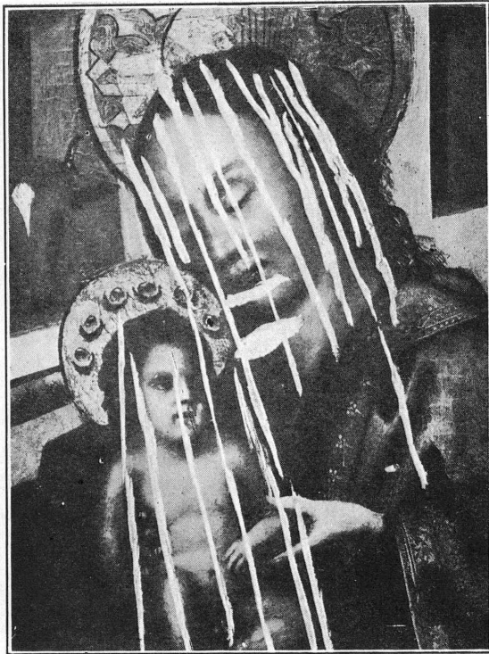
FIG. 2. — Groupe de la Vierge et de l'Enfant avant la restauration, avec les balafres marquées en blanc.