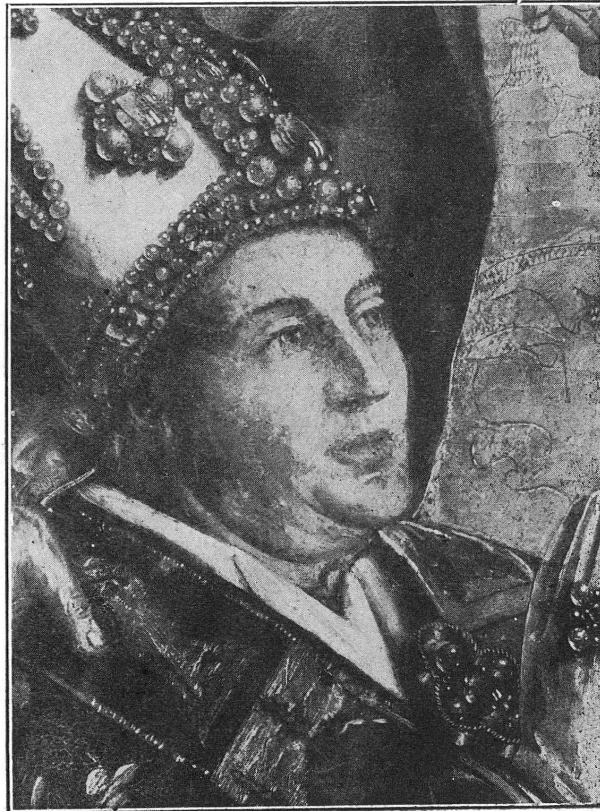
FIG. 6. — Le même, état actuel.