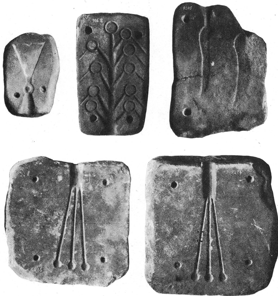
FIG. 2. — Moules du Musée de Genève. 9208, B 9146, 9205, 9197, 9204.

657 et 710 Eaux-Vives. Dimensions: 0.27 \times 0.13 et 0.20 \times 0.08 . Deux valves appartenant à deux formes différentes, pour la fonte de haches à ailerons du Bronze IV. Le canal de fonte est à la partie supérieure et flanqué dans l'une des valves de deux canaux d'évent. Les deux pièces présentent la même parti-