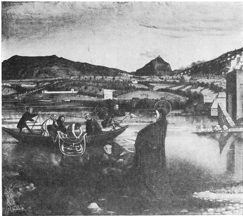
FIG. 4. — Retable de Conrad Witz. Musée de Genève. Détail : La pêche miraculeuse.

ville célèbre des Allobroges ou Savoisiens... ». Rien n'est plus vrai. Il n'est pas nécessaire de supposer à notre peintre de subtils desseins. A coup sûr il n'a pas voulu, par anticipation, prendre parti dans la querelle des zones, ni manifester son opinion au sujet de la destinée de Genève. Il n'est pas moins piquant de voir son œuvre apparaître dans l'iconographie genevoise au moment même où se célèbre le quatrième centenaire d'une première démarche vers les Suisses, car notre livre d'heures est un représentant authentique et indiscutable de l'orientation inverse, celle de la nature, opposée à la direction qu'ont préférée les hommes. Ainsi, témoin naïf du moyen âge, une modeste miniature, seule de son espèce parmi les innombrables vues de Genève, se charge de signification pour nous apparaître comme un vrai tableau d'histoire.