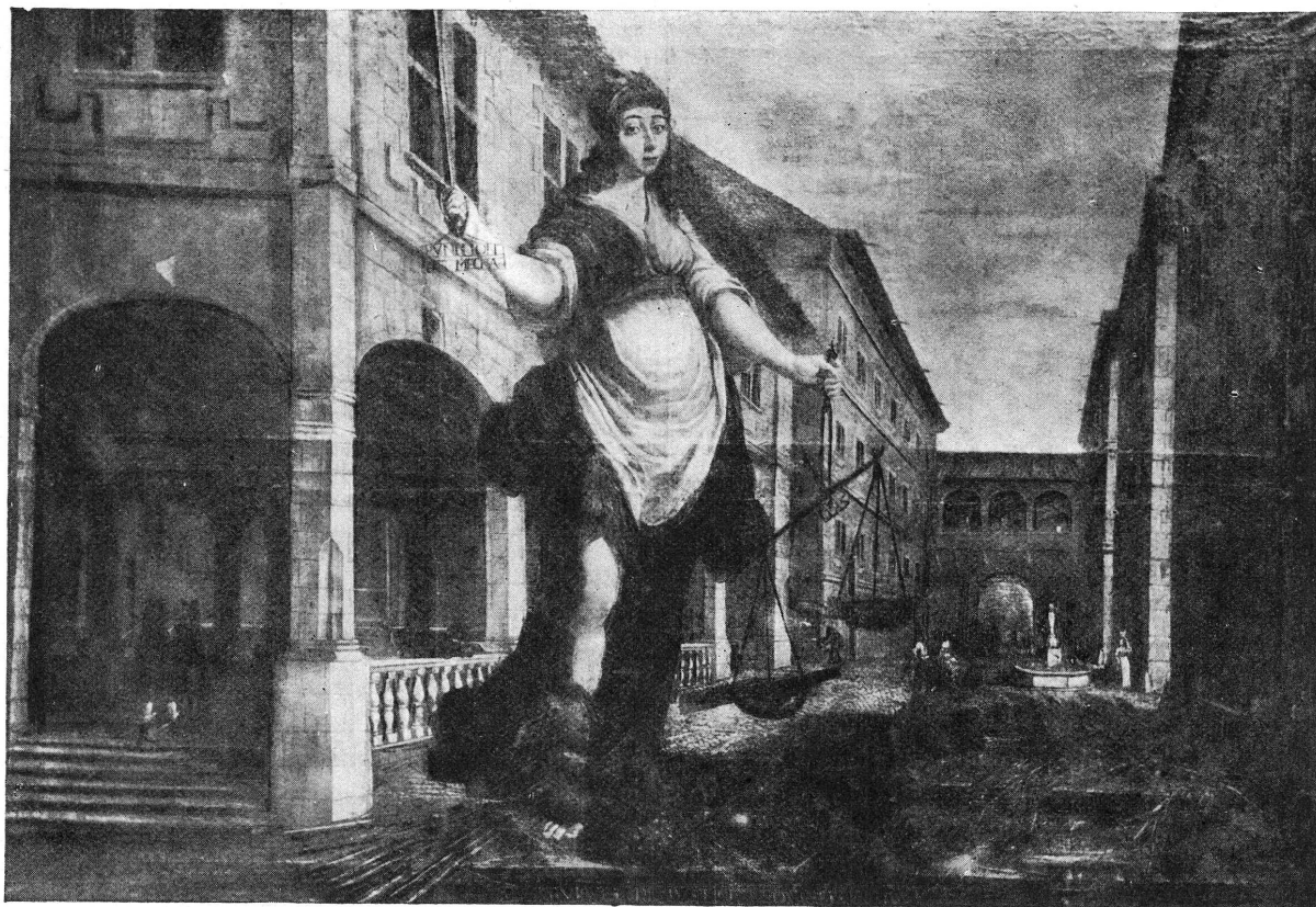
FIG. 1. — La Justice. Musée d'Art et d'Histoire, n° 501.

tous les édifices du XVII e siècle 1 . Voici une estampe de la collection Rigaud (Bibliothèque publique), « La Paix descendant du ciel le 10 février 1789 sur la République de Genève » : c'est la place de l'Hôtel de Ville avec l'ancien arsenal à droite, à gauche l'Hôtel de Ville, la fontaine au centre 2 . Voici celle de Geissler, « le Retour du Conseil général » tenu le 10 février 1789 3 ; voici la gravure de 1822 par Escuyer 4 .