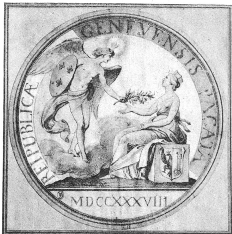
Fig. 2. — Dessin de Bouchardon (Bibliothèque de Genève).