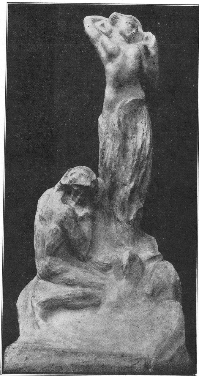
FIG. 2. — Rodo de Niederhäuern. Le Jet d'eau.

pas la perte des peintures murales et des monuments que nous aurions dû leur commander.