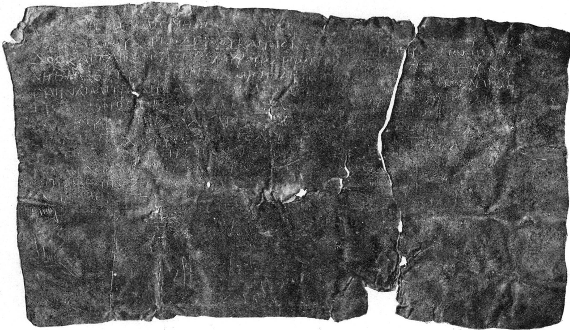
FIG. 1. — Tablette magique. Genève, Bibliothèque publique et universitaire.

C'est en application d'une recette analogue qu'a été gravée la tablette de plomb qui fait l'objet de cet article. Elle a été confectionnée pour un cas concret en suivant les indications d'un livre de magie qui, sans être identique au manuel cité, offrait