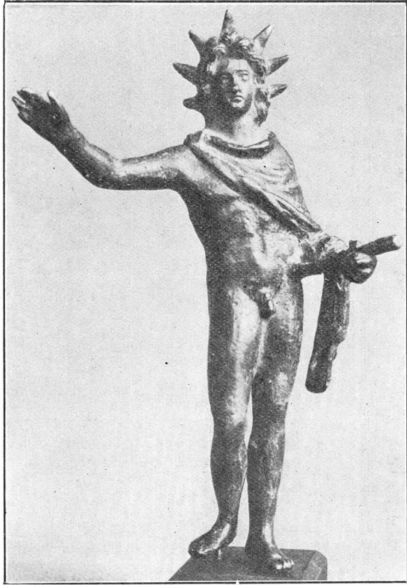
FIG. 1. — Hélios de Sainte-Colombe.

ouverte, paume en avant, fait le geste habituel; dans la main gauche, Hélios tient un bâton, sans doute le manche de son fouet. Sa tête, à l'abondante chevelure bouclée, porte la couronne aux sept rayons symbolisant les planètes. A de légères