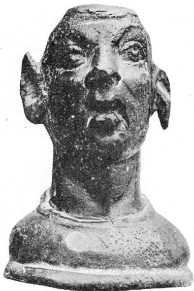
FIG. 3. — Tête grotesque. Salève.

6. — C. 490-493. — Provenance: Avenches, 1876. — Fragments (corps et queue) d'une statue de cheval . Epoque romaine.