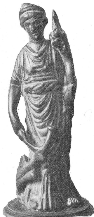
FIG. 2. — Fortune de Messery.

5. — 7463. — Provenance: fouilles de la Grotte de la Grande Gorge, au Salève, Haute-Savoie; trouvé par le Dr Roussel, en 1872, en même temps qu'un couteau, des chaînettes de bronze, des fragments de poterie; le sol fut creusé à 7 mètres de profondeur sans rencontrer le roc. — Buste d'homme imberbe (fig. 3), aux traits caricaturaux, asymétriques, au nez proéminent, aux lèvres épaisses, à l'expression niaise. Des oreilles longues et pointues, animales, la gauche est abaissée, la droite est relevée. Le crâne, aplati au sommet, n'a qu'une mèche sur l'occiput. Le personnage porte un vêtement avec capuchon dans le dos. La base est évidée, et on y voit les restes d'une tige carrée ayant servi à fixer l'objet ou à y suspendre quelque chose. Patine vert-foncé. Epoque romaine. Haut.: 0,063. Le bronze servait sans doute de peson de balance. Les oreilles semblent indiquer un Satyre ou un Silène, et l'on sait que ces êtres sont souvent employés à cet usage 1 ; d'autre part, le vêtement à cucullus