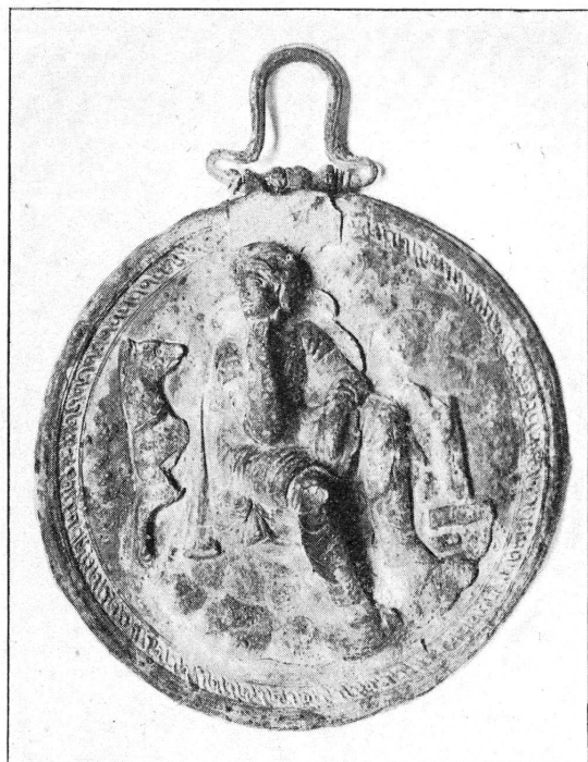
FIG. 1. — Miroir grec à relief.

Nous reproduisons encore des boucles d'oreille en or, qui ne sont pas des acquisitions récentes, mais qui méritent d'être signalées ( fig. 2 ).