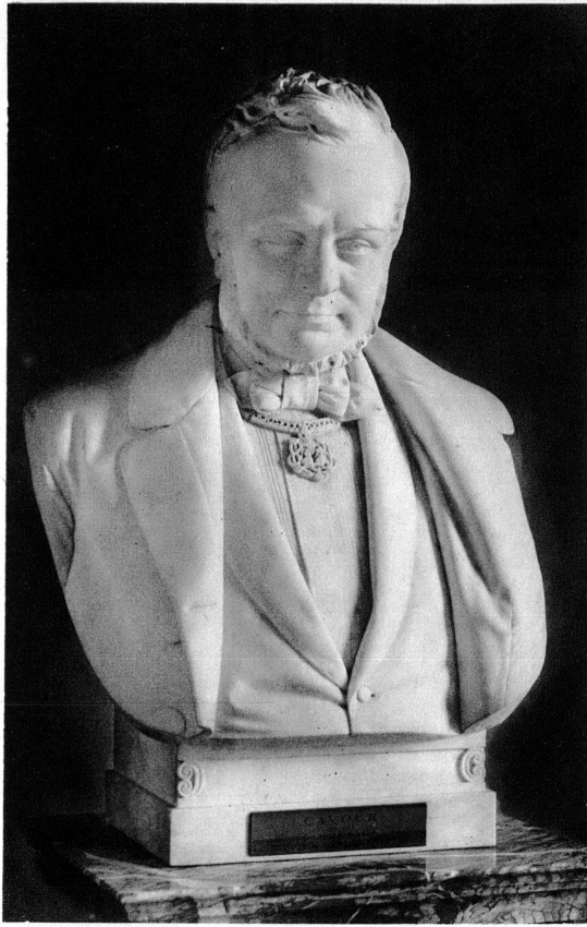
CAVOUR par V. Vela (1869)