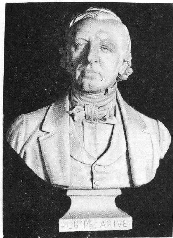
FIG. 1. — Auguste de la Rive, par Charles Töpffer (1880).

Pellegrino Rossi (1787-1848) s'était réfugié à Genève en 1815, après l'expédition malheureuse de Murat, à laquelle il avait pris part. Accueilli par le baron Crud, dans sa propriété de Genthod, il fut mis en relations avec les milieux intellectuels gene-