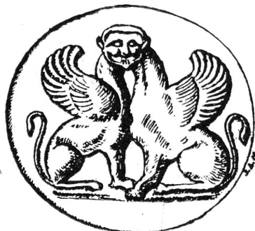
FIG. 2. — Intaille archaïque. (Musée d'Art et d'Histoire, MF. 1535.)

2. MF. 1535. — Sphinx à deux corps et une seule tête . Intaille, époque archaïque (fig. 2).