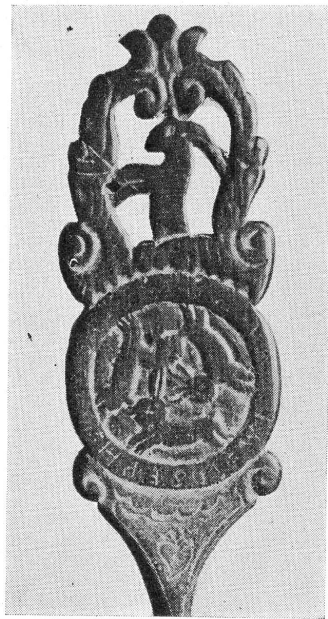
FIG. 4. — Cuiller du XVIII e siècle. (Musée d'Art et d'Histoire, n o 4637.)