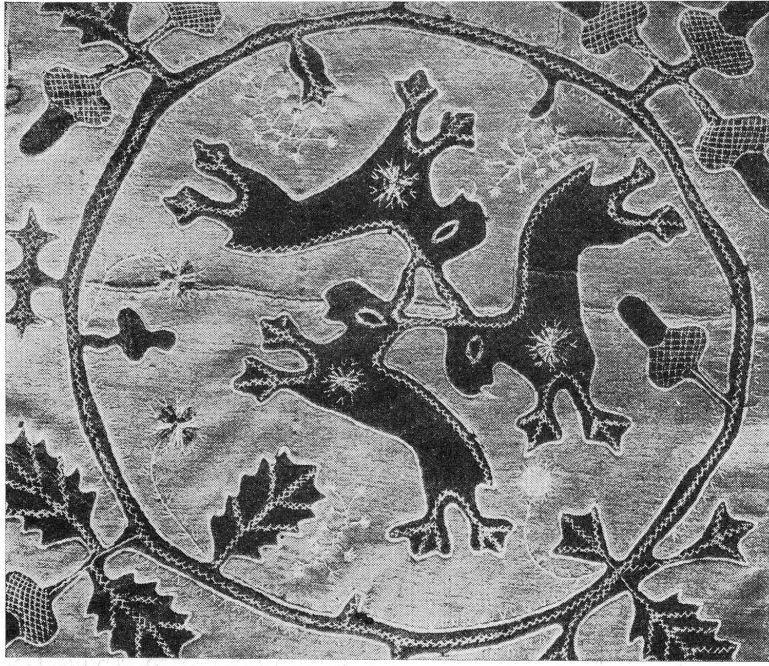
FIG. 3. — Tapis du XVIII e siècle. (Musée d'Art et d'Histoire, n o 5023.)