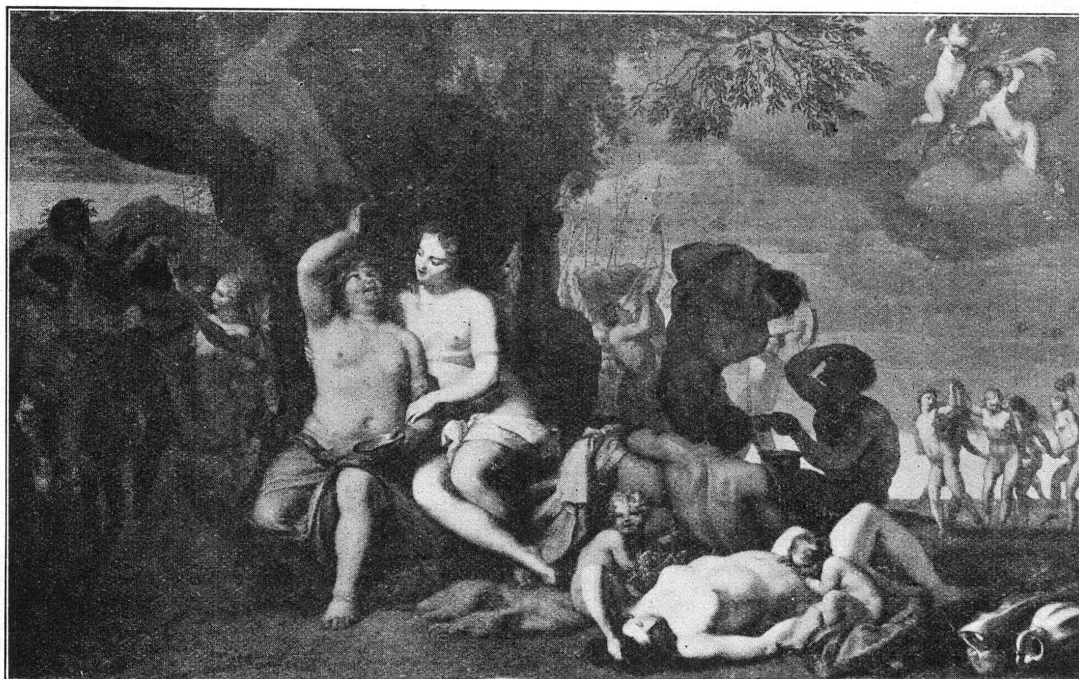
FIG. 1. — BARENT GRAAT. Bacchanale. (Avant la restauration).

1. Bacchus: apparition des jambes originales; la peau de tigre revient sur le genou.