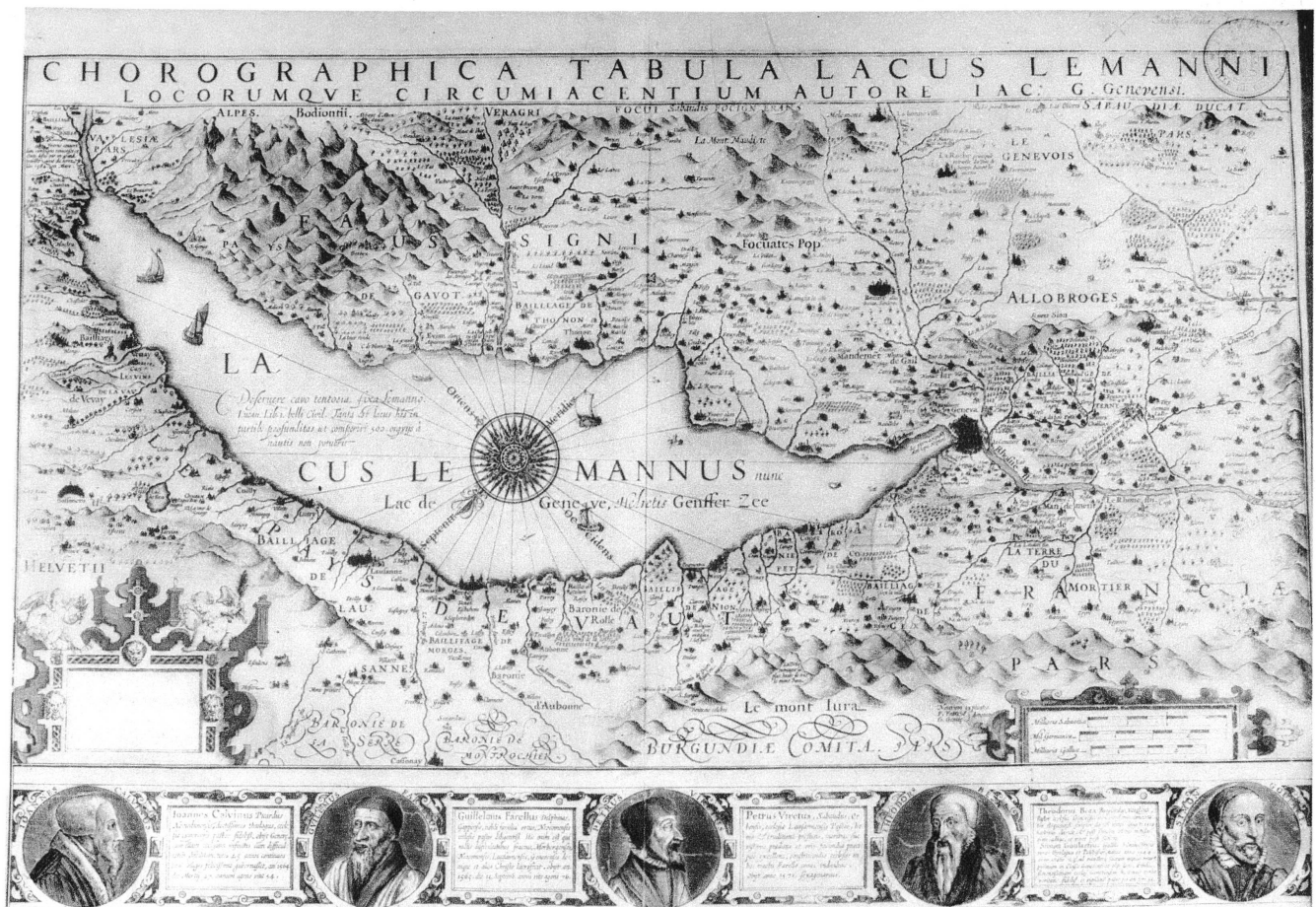
Pl. XX. — Carte du lac Léman, de Jacques Goullart, genevois (1605).