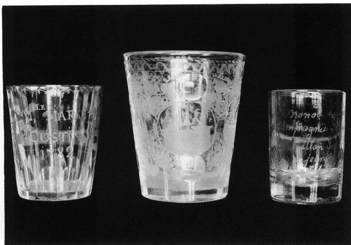
Pl. XXIII. — Verres gravés des fabriques du Doubs, Musée de Genève. — En haut : 13747, 13604. — En bas : 8156, 13450, 5917.