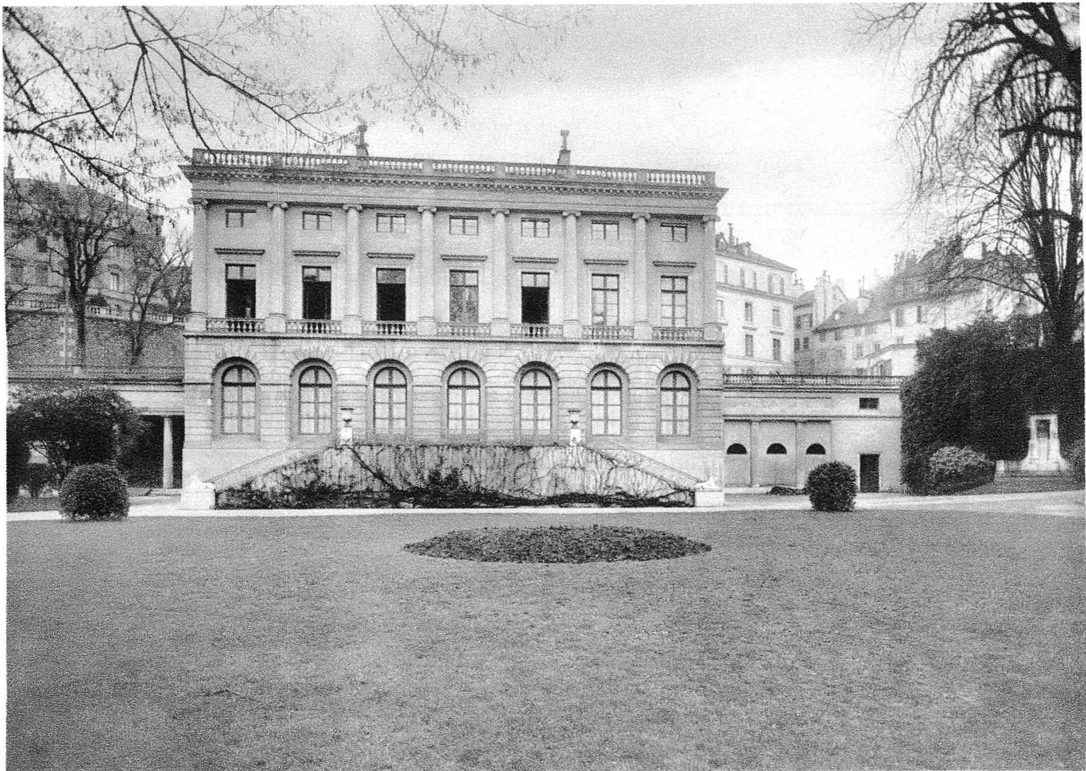
Pl. XXIV. — Le Palais Eynard, à Genève. — En haut : gravure au trait, 1817. — En bas : état actuel.