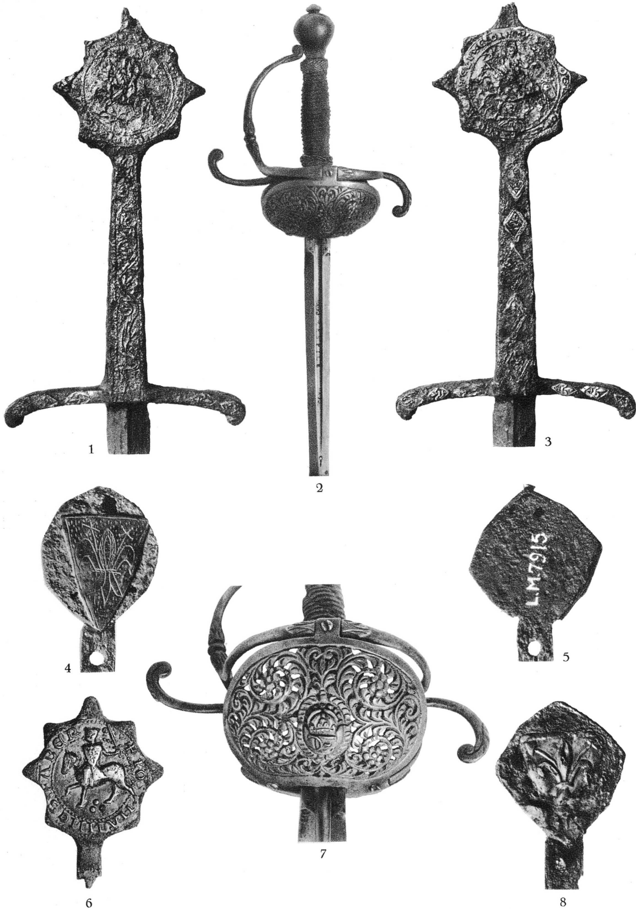
Pl. XVI. — 1. 3. 2166. Dague de Bourgogne. Cf. pl. XV, No 2. Musée de Genève. — 2. 7. 2153. Epée de Charles Emmanuel I, duc de Savoie. Musée de Genève. — 4. 5. 8. LM 10221. LM 7915. LM. 7007. Dagues de Bourgogne. Musée de Zurich. — 6. 2165. Dague de Bourgogne. Cf. pl. XV, No 1. Musée de Genève.