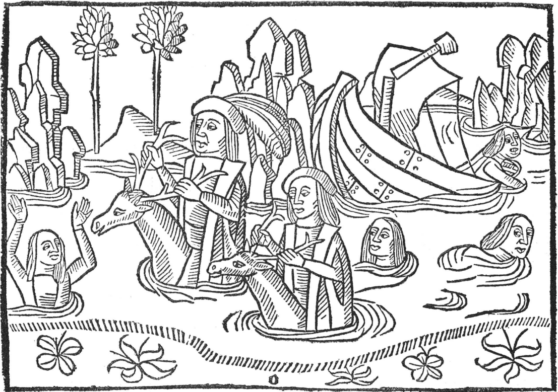
Fig. 1. — Olivier de Castille (f o b 5 v o ) : Olivier et son compagnon miraculeusement sauvés après une tempête.

Le FONDS AUXILIAIRE a fait don de divers ouvrages et a contribué à l'achat d'un incunable genevois, la deuxième édition de l' Histoire d'Olivier de Castille 1 , imprimée à Genève par Louis Garbin dit Cruse, vers 1492, et ornée de nombreuses gravures sur bois 2 . On ne connaît de cette édition que cinq ou six exemplaires, qui présentent presque tous des variantes et dont deux au moins sont incomplets. C'est un de ces deux derniers dont la Bibliothèque s'est rendue acquéreur ; il lui manque douze feuillets (sur 56) et huit gravures (sur 40).