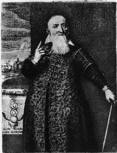
Theodorus de Mayerne Eques, Baro in Aubonne Consiliarius, et Medicus Primarius Regis, et Reginae Magnae Britanniae

THEOD. TURQVETI D. DE MAYERNE, Equitis, Baronis in Aubonne, Consiliarij & Medici primarij REGIS & REGINÆ MAGNÆ BRITANNIÆ, TRACTATVS DE ARTHRITIDE.