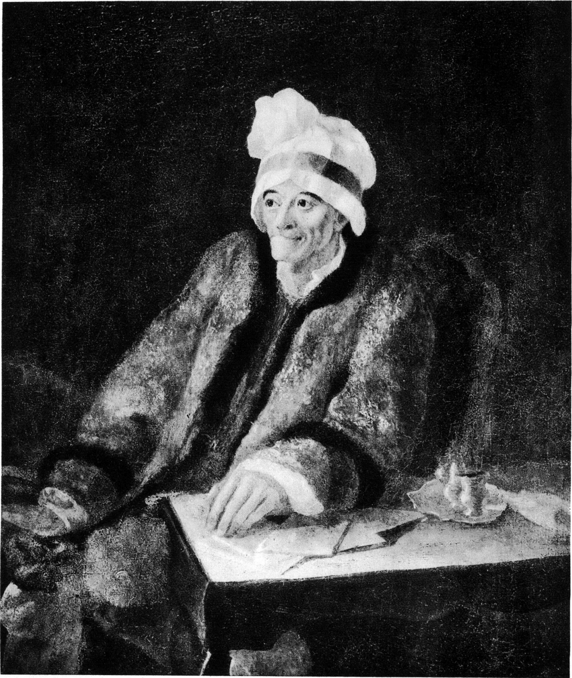
Pl. XII. — Portrait de Voltaire, par Jean Huber. — Musée du Vatican.