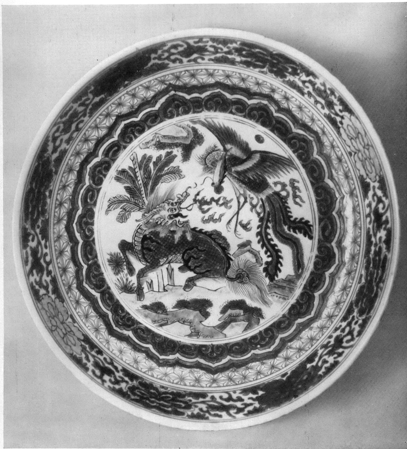
PL. II. — Chine. Plat en couleurs émaillées, époque Ming. — Genève, Musée Ariana.