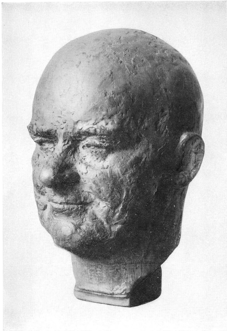
Pl. II. — P.-M. Baud. Portrait de Charles-Albert Cingria, terre cuite. Musée de Genève.