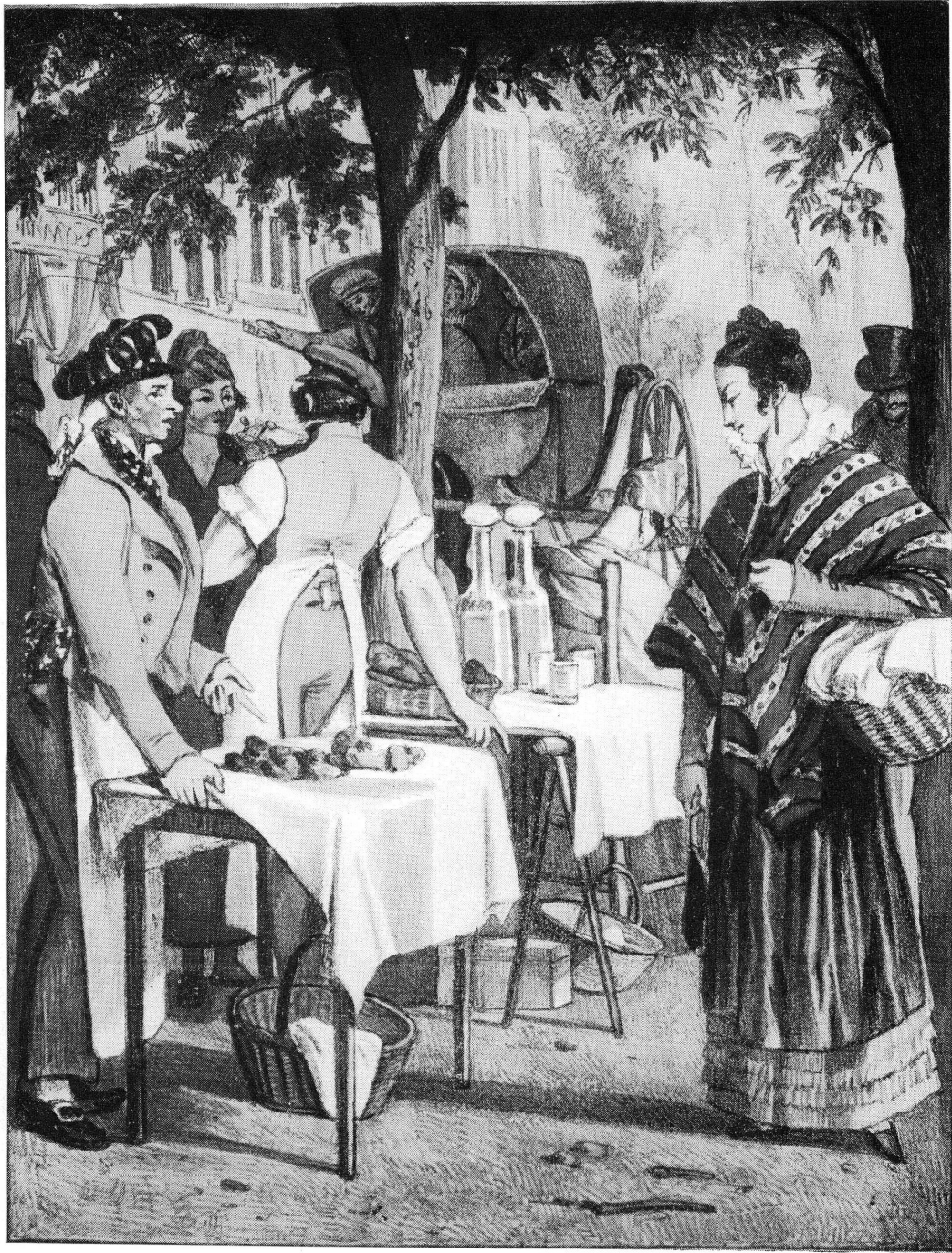
PL. III. — J.-J. Chalon, Le marchand de brioches. — Musée de Genève.