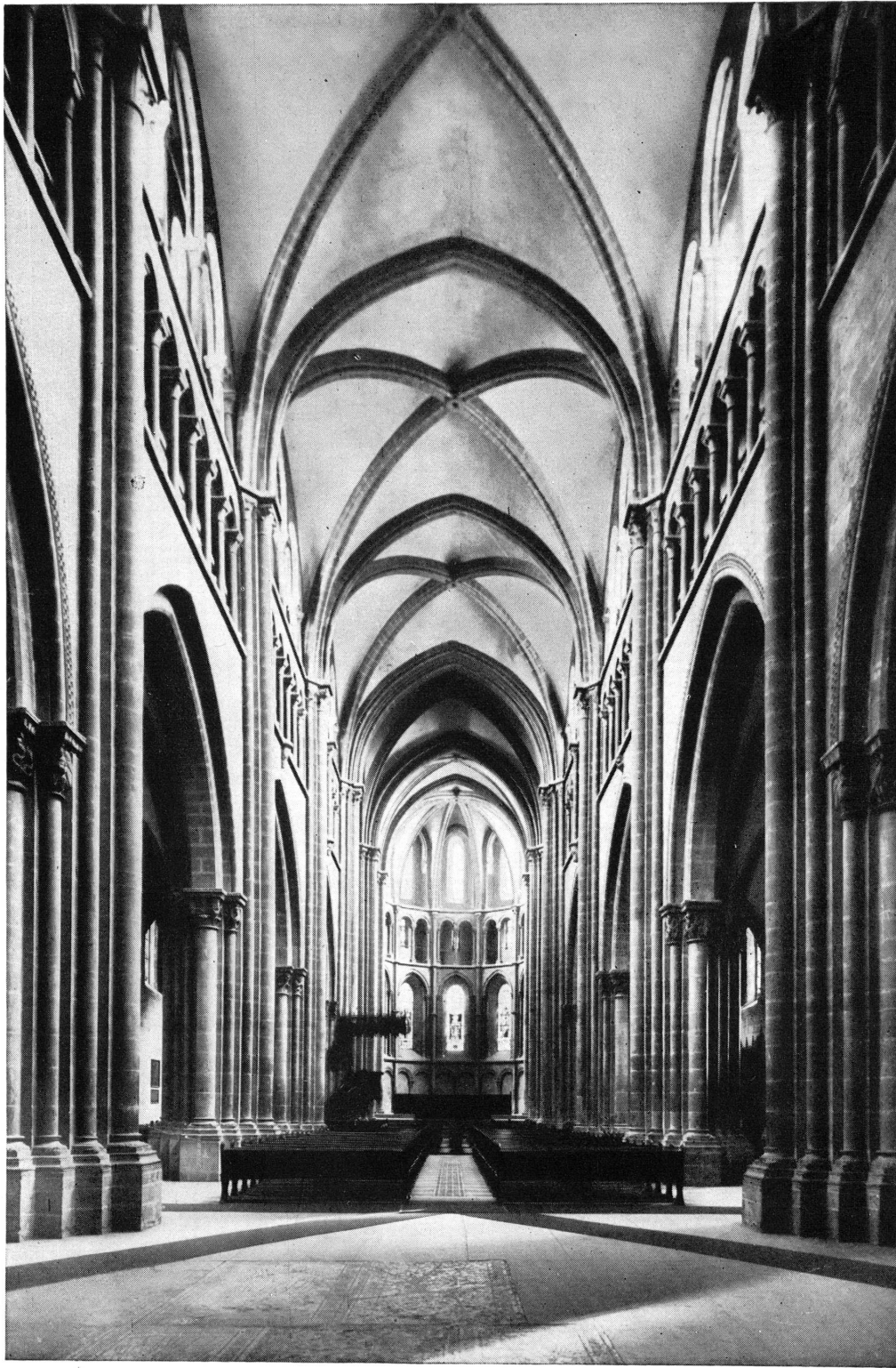
PL. X. — Saint-Pierre. Intérieur vu de l'entrée.