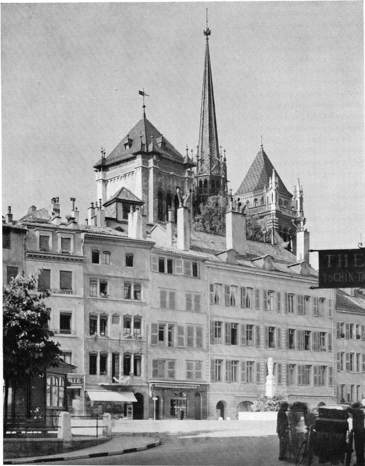
Pl. IX. — Saint-Pierre et la place du Bourg-de-Four.