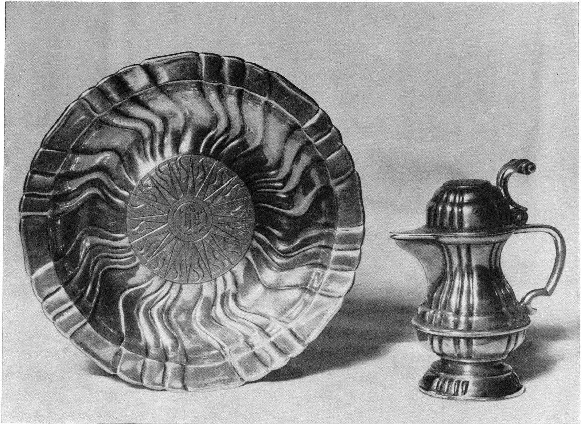
Pl. XII. — Aiguière et son présentoir, argent, XVIII e siècle. Saint-Pierre, Genève, sacristie.