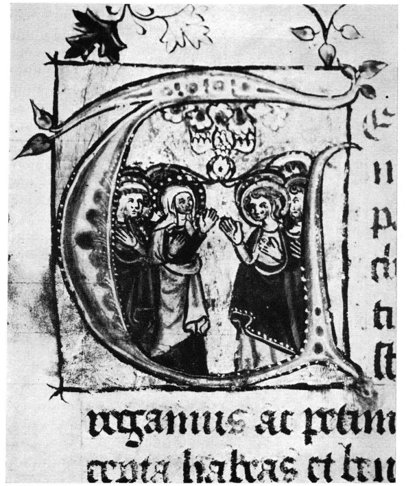
PL. XIII. — Miniatures du « Missale ad usum Gebennensem », XV e siècle. Bibliothèque publique, Genève.