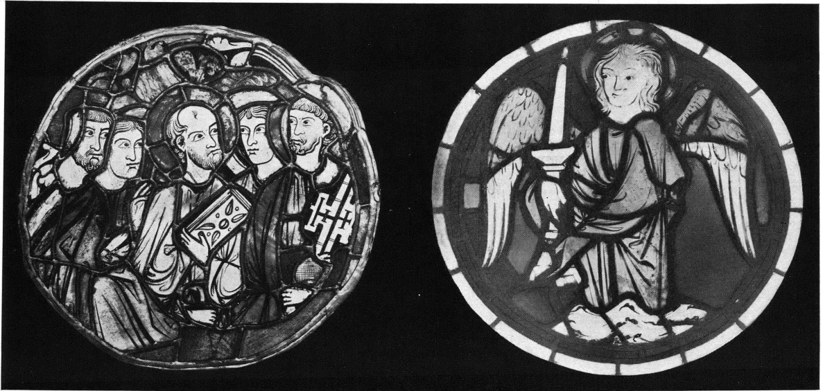
Pl. XIV. — A gauche: Saint Pierre et saint Paul dans un groupe d'apôtres, n° 72. A droite: Un ange porte-cierge, n° 92. Musée Ariana, Genève.