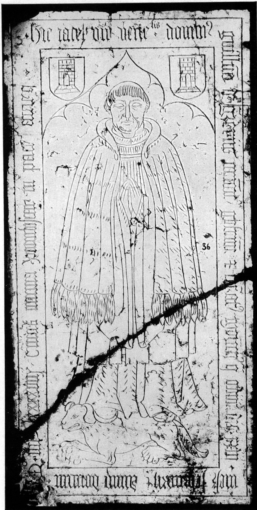
Pl. XIII. — Guillaume de Greyres, † 1498. — Musée de Genève, N° 36