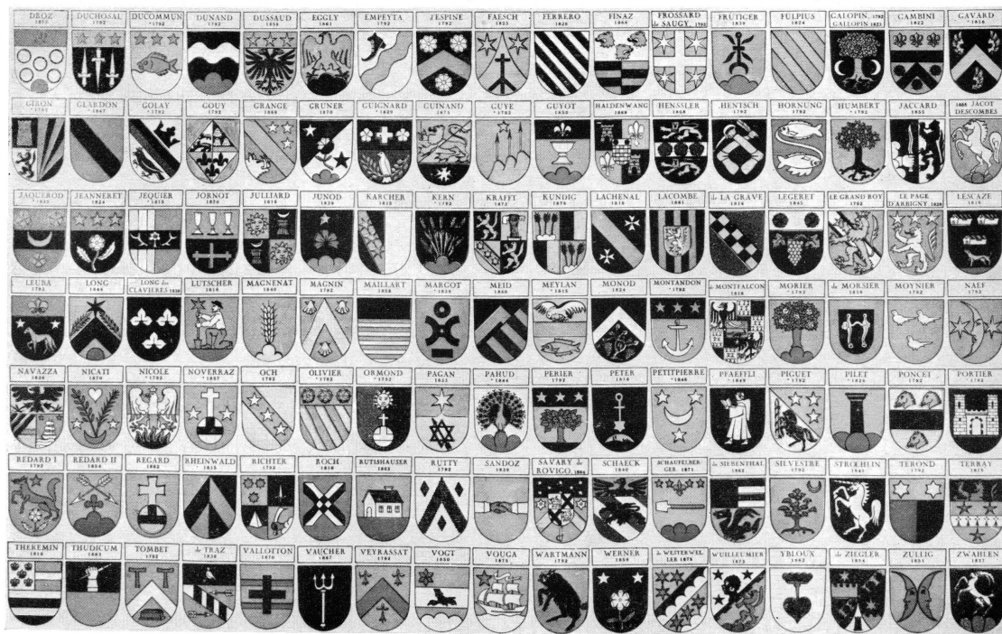
Pl. XVII. — Armoiries des familles reçues citoyennes genevoises de 1792 à 1875. (Suite de la pl. XVI.)