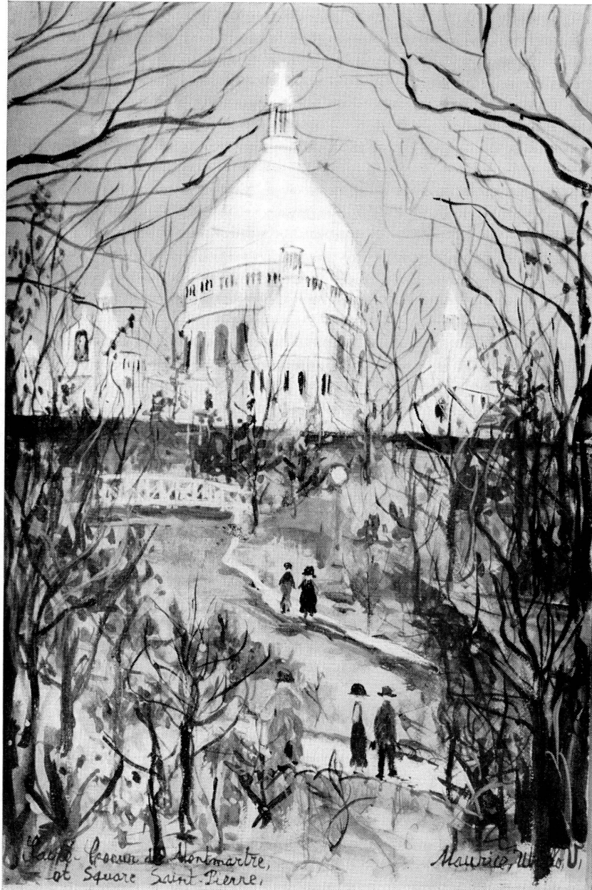
Maurice UTRILLO - Le Sacré-Cœur (Musée d'art et d'histoire, Genève)