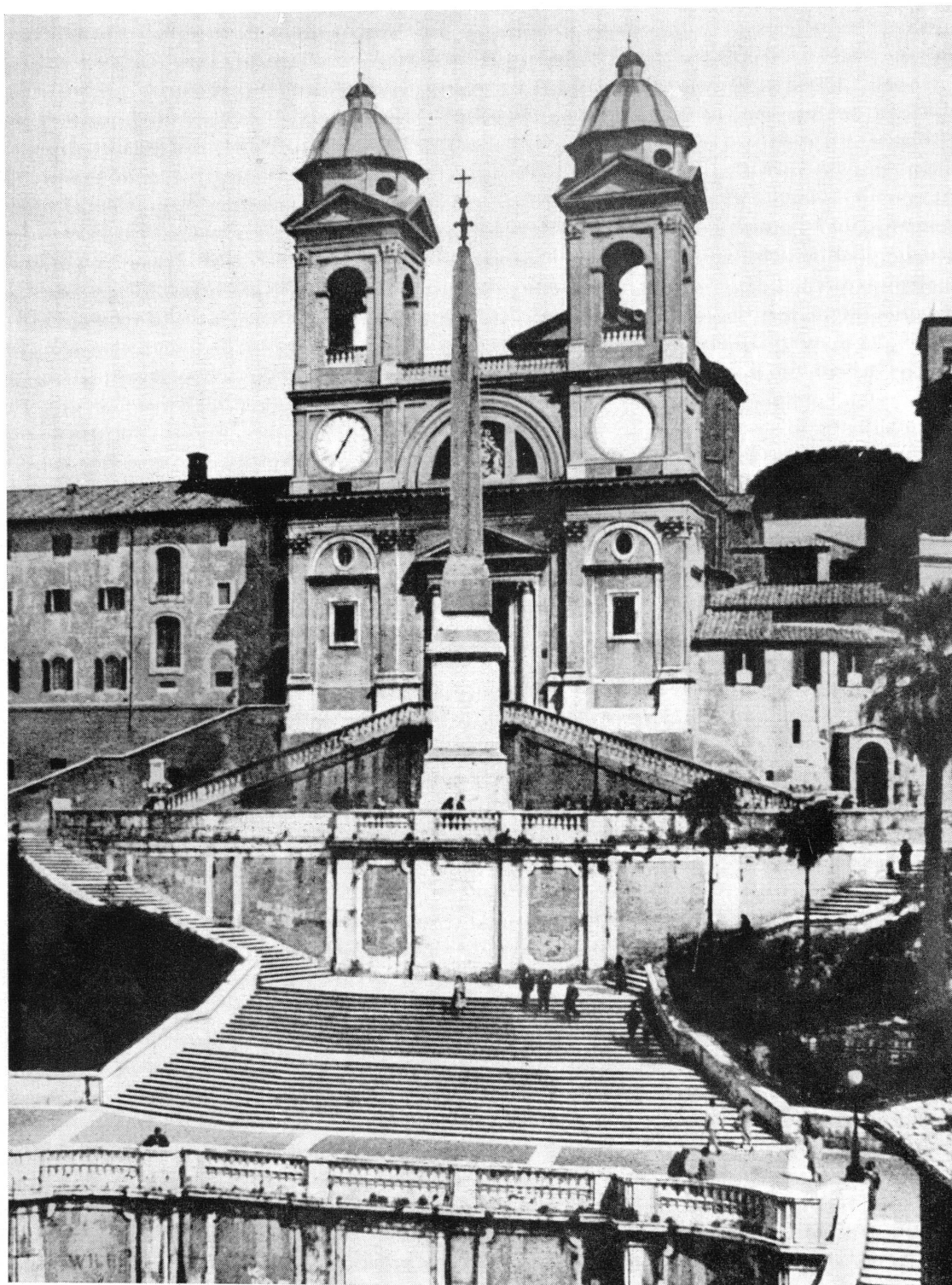
Fig. 41. — Rome. Eglise de la Trinité-des-Monts.