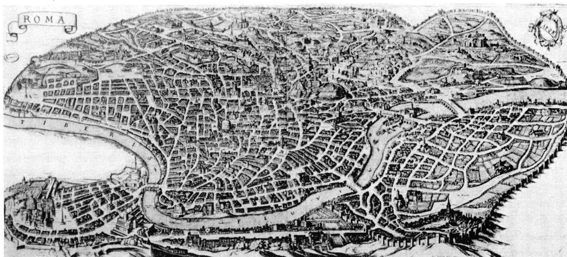
Fig. 39. — Plan de Rome au moyen âge (British Museum).

Rome était restée une ville du moyen âge. Plan inexistant, rues tortueuses,