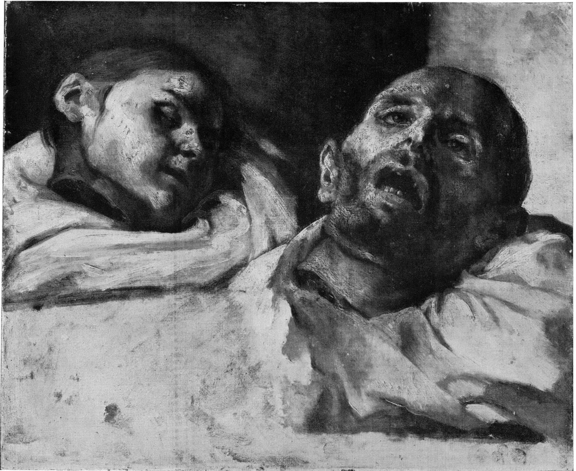
Fig. 34. — Th. GÉRICAUT : Têtes de suppliciés . Stockholm. Musée national.