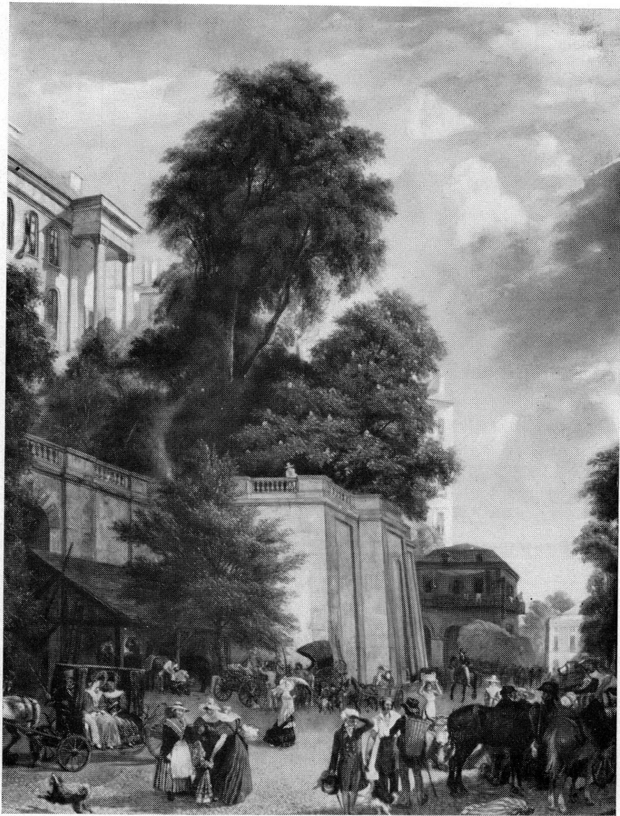
Fig. 4. — Jean-Jacques CHALON: La Corratierie , MAH 1957-20.