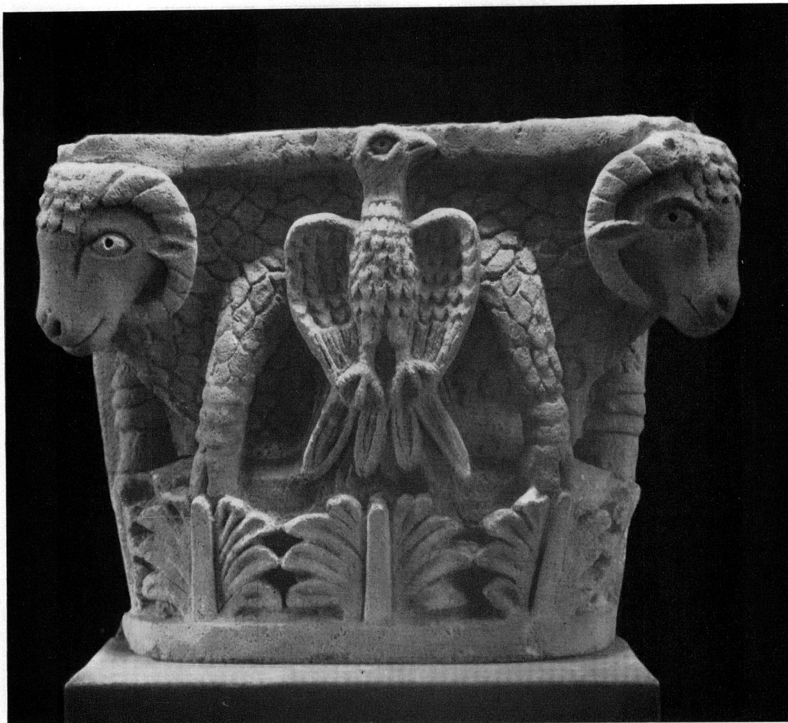
Fig. 2. — Chapiteau copte en calcaire. MAH 19512.