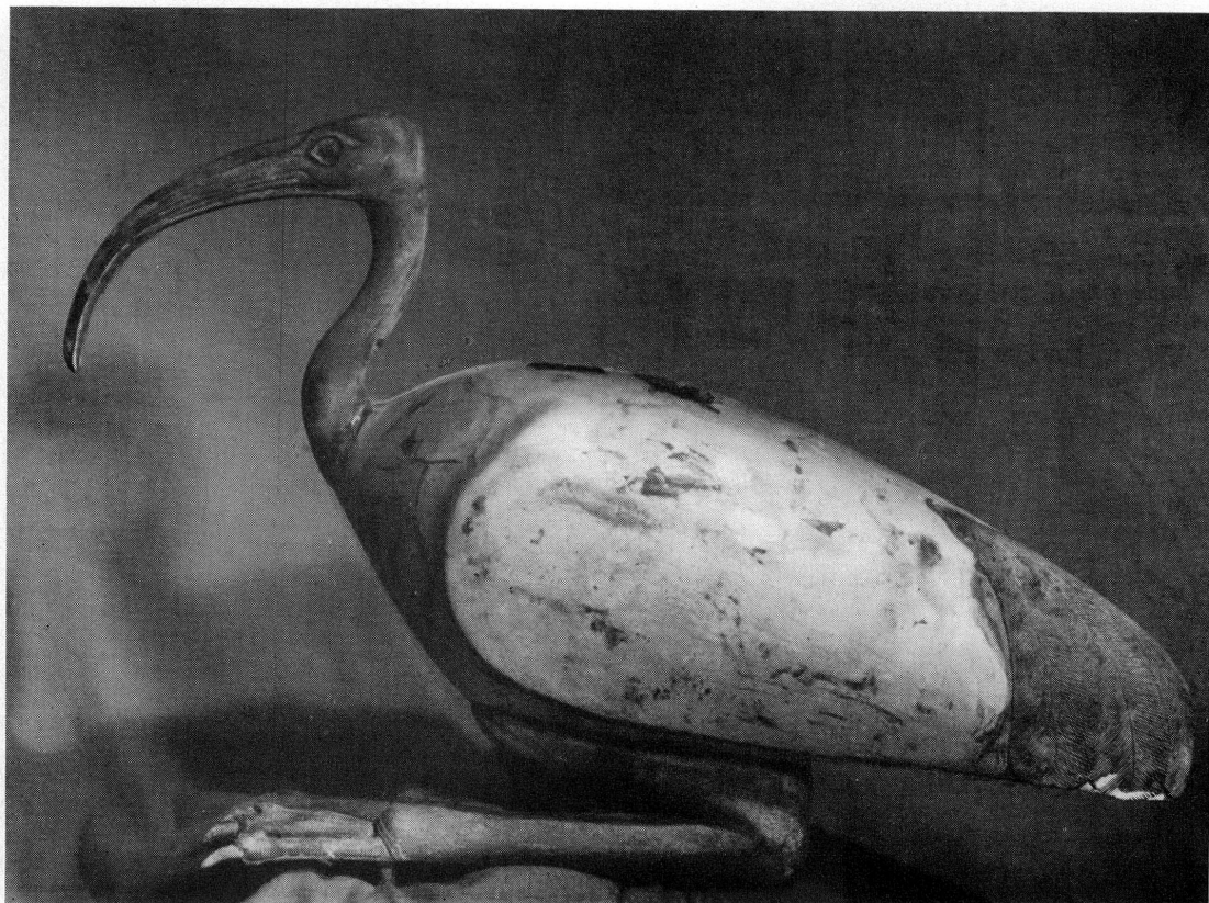
Fig. 1. — Ibis en bois doré et bronze. MAH 19510.