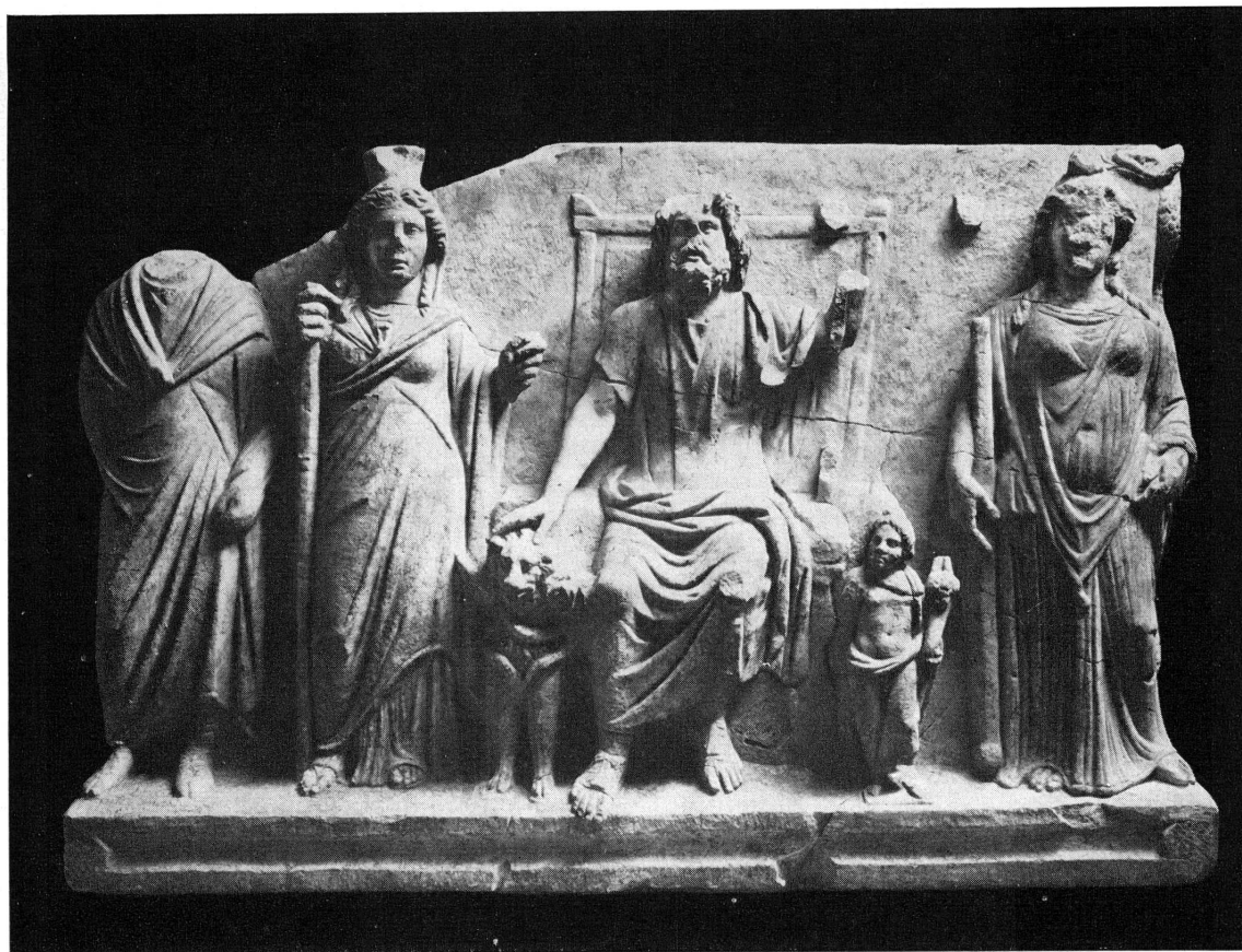
Abb. 4. — Weihrelief mit Sarapis zwischen zwei Göttinnen und Harpokrates, links der Stifter. Rom, Capitolin. Museum.

antiken Schriftrolle später aussah 23 . Im jetzigen Zustand erzeugt der Genfer Kopf nur noch durch die für die Bemalung berechnete, ungeglättete Oberfläche des Haares zusammen mit den polierten Hautpartien einen gedämpften koloristischen Effekt.