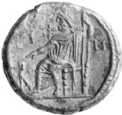
Abb. 5. — Alexandrinische Münze mit dem Kultbild des Sarapis. Bern, Histor. Museum.

Geheimnisvoll, fast düster und doch mit Huld blickt der Gott aus seinen verhangenen Augen. Er gehört nicht mehr zu den θεοὶ βέλτεροι ζώοντες, den leicht lebenden Olympiern, wie der Apollon vom Belvedere oder gar der Sauroktonos, der sich im Saale gerade vor ihm seiner ungetrübten Seligkeit hingibt 25 . Auch diese ganz andere aus der klaren Geistigkeit Göttergestalten ins Unbegreifbare, Mystische entrückte Gottesauffassung ist wohl erst durch die römisch-ägyptische Verwandlung in das Bild des Sarapis hereingekommen. Erst durch die Zutat der steif gedrehten Stirnlocken wurde der Gott äusserlich als Ägypter gekennzeichnet. Noch handgreiflicher wird die Barbarisierung in der Umwindung des Kerberos durch die Schlange fassbar (Abb. 4) 25a . Die ursprüngliche Schöpfung, die Ptolemaios I.