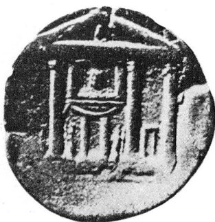
Abb. 3. — Alexandrinische Münze mit Front des Sarapistempels.

endete die Lehne ziemlich genau auf der Höhe des oberen Schmittrandes, dagegen ist sie auf Münzbildern (Abb. 5) 20 und etwa bei dem Septimius Severus als Sarapis am Bogen von Leptis Magna 21 niedriger. Die Kopisten fühlten sich demnach in der Behandlung dieses Details nicht sonderlich gebunden. Die Frage, wie die Verhältnisse am Original waren, muß daher offen bleiben. Die meisten Kopfrepliken sind allerdings rundum ausgearbeitet. Auch bei hoher Rückenlehne wird der Gott des originalen Kultbildes den Kopf frei getragen haben; aber es ist trotzdem denkbar, daß selbst kolossale Wiederholungen, zumal bei einer Bestimmung für ausschließliche Vorderansicht, zu einer vereinfachenden, mehr reliefartigen Lösung kamen 22 .