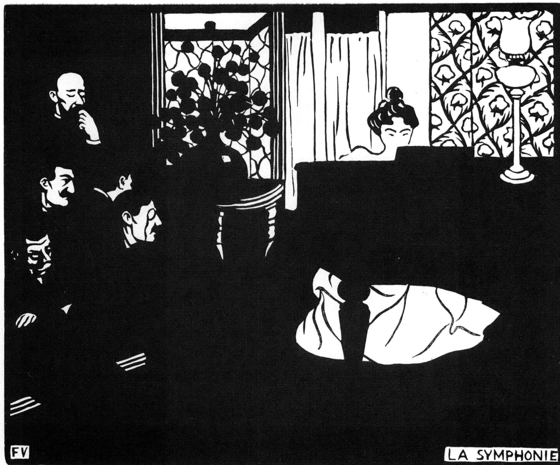
Fig. 4. — F. Vallotton: La symphonie , Bois.