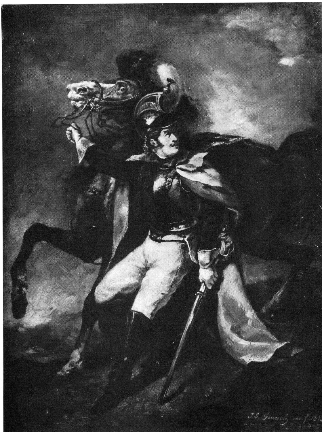
Fig. 2. — Théodore Géricault: Le cuirassier blessé (étude). Huile.