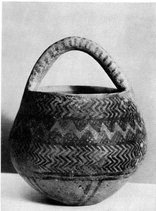
Fig. 1. — Vase à décor noir sur fond rouge. Perse. (19706)

19703. — Vase en terre cuite grise à pied et anse latérale. Tepe Djamshidi? Hauteur: 240 mm.