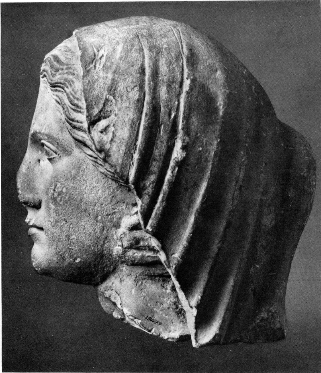
Fig. 4. — Tête féminine voilée, MAH n° inv. 19477