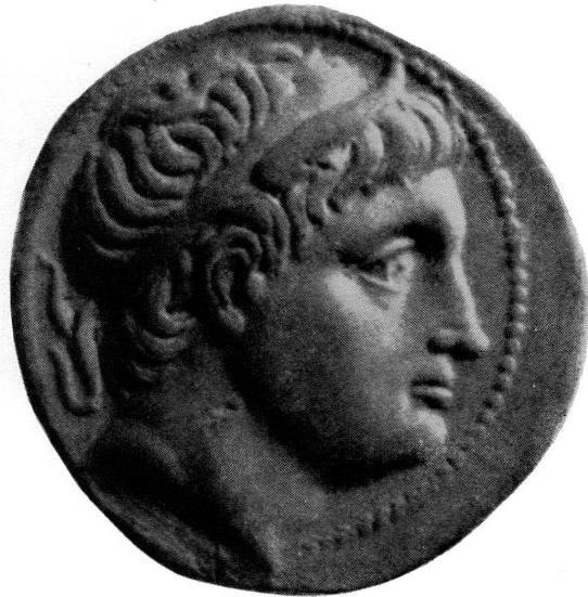
Fig. 9. — Démétrius Poliorcète, tétradrachme d'Amphipolis (d'après E. T. Newell, The Coinages of Demetrios Poliorcetes , pl. IX, 15)