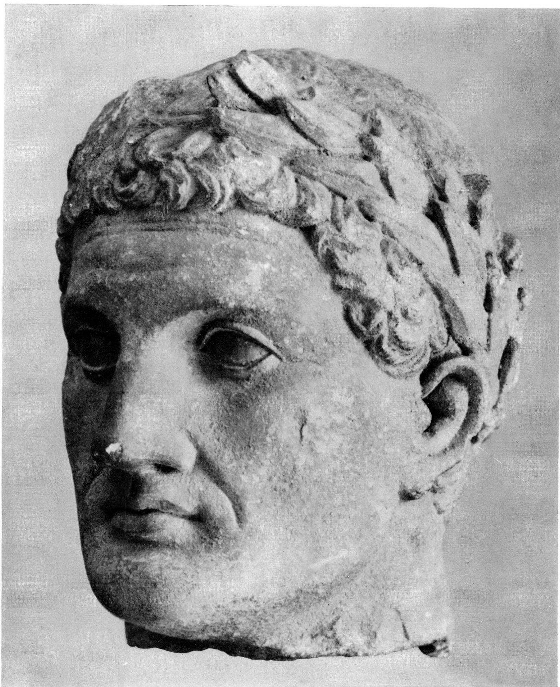
Fig. 7. — Tête virile laurée, MAH n° inv. 19720