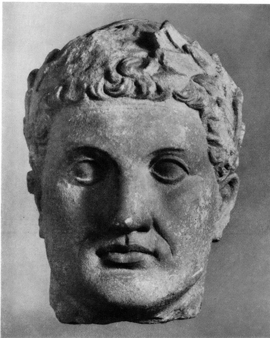
Fig. 5. — Tête virile laurée, MAH n° inv. 19720