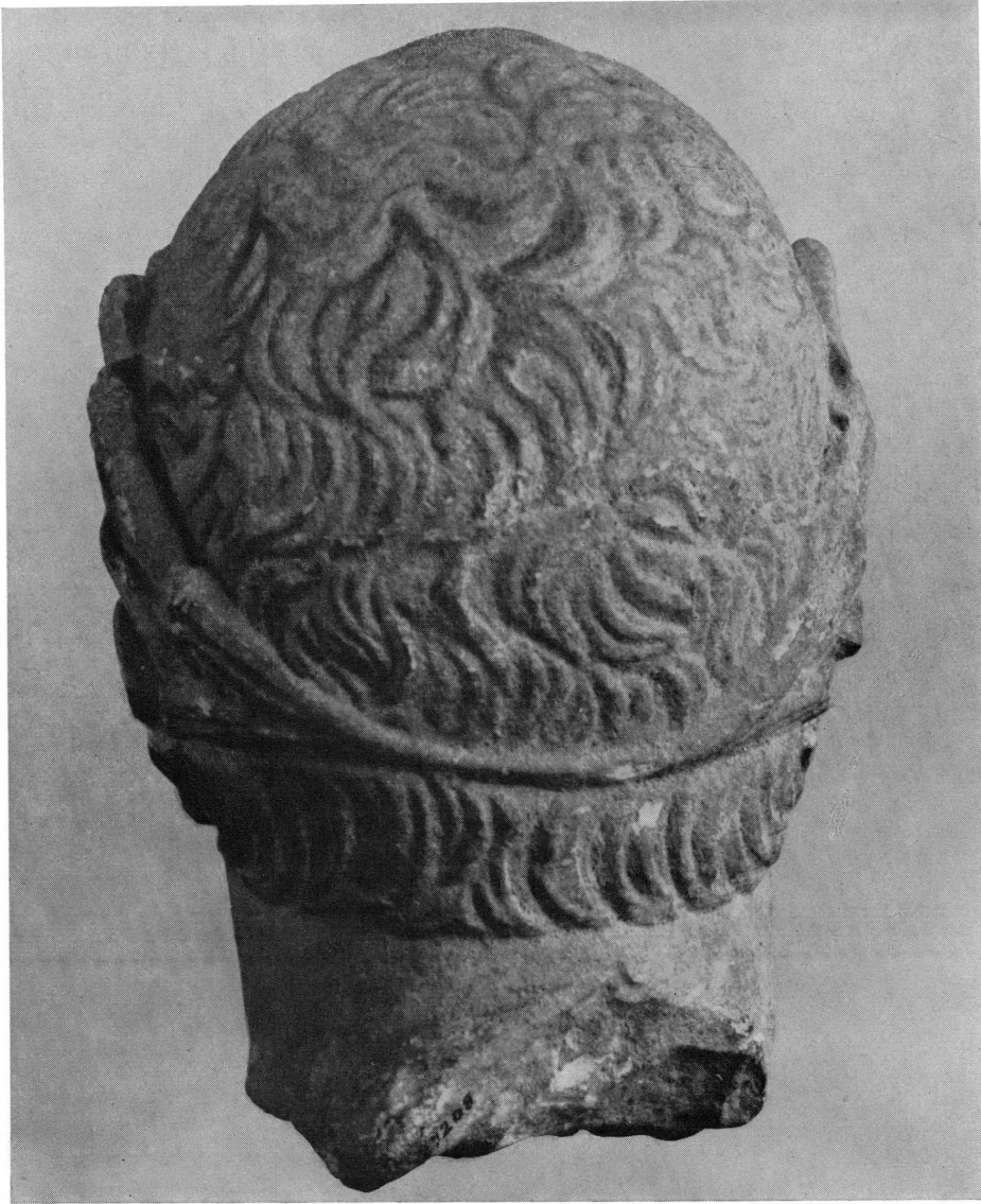
Fig. 6. — Tête virile lauree, MAH n° inv. 19720