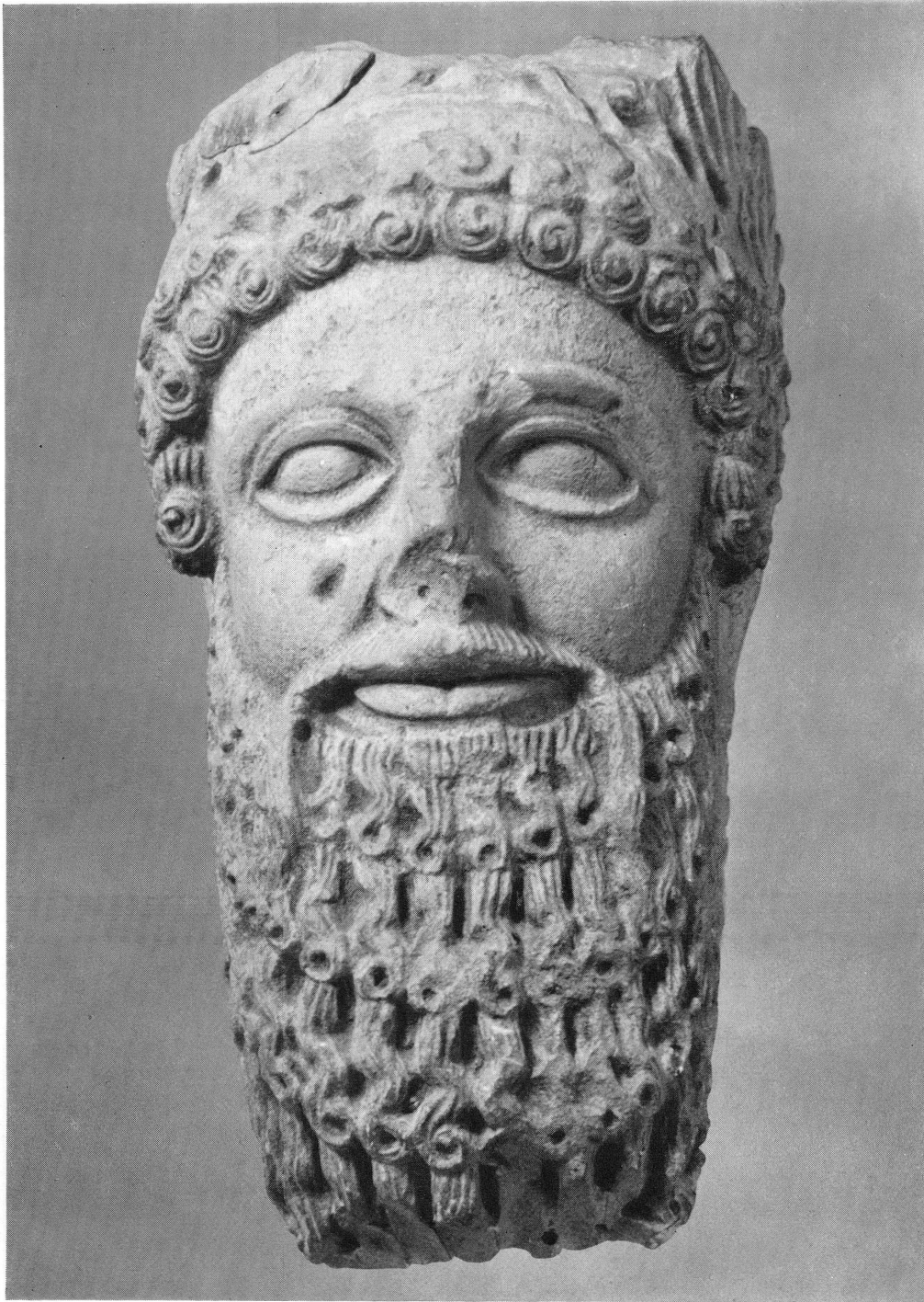
· Fig. 2. — Tête barbue archaïque, MAH n° inv. 19701