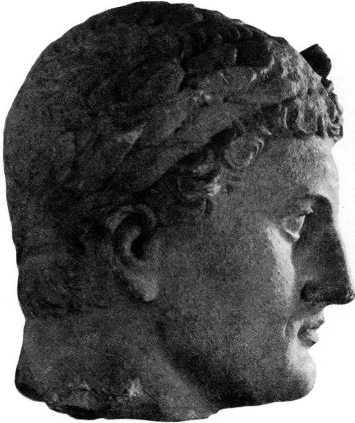
Fig. 8. — Tête virile laurée, MAH n° inv. 19720