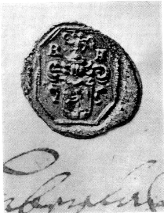
Fig. 1. — Armoiries et signature de Gottfried Haberlandt