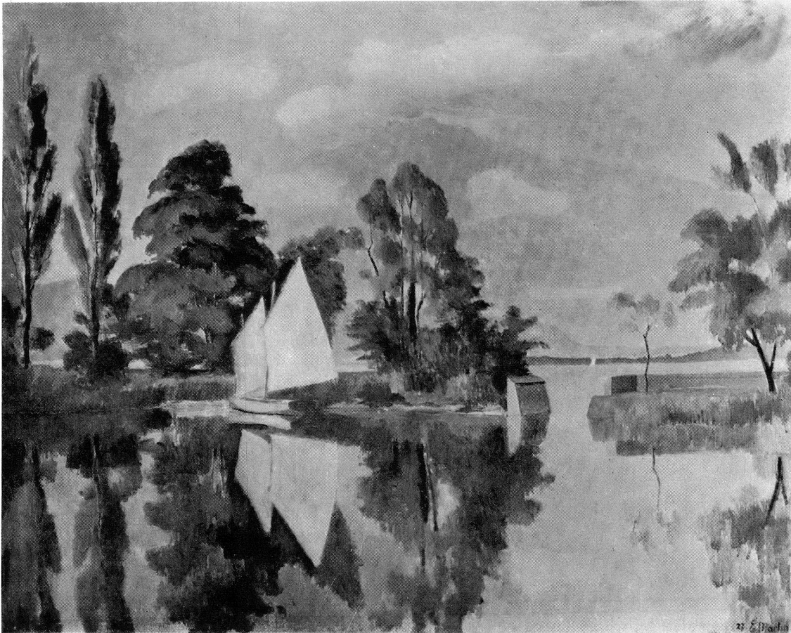
Fig. 3. Le Goulet (1927).