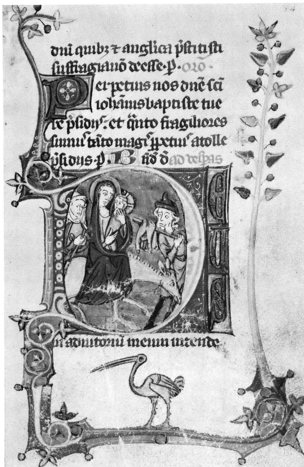
Fig. 1. Livre d'heures de la comtesse de Genève. F o 54: Fuite en Egypte.