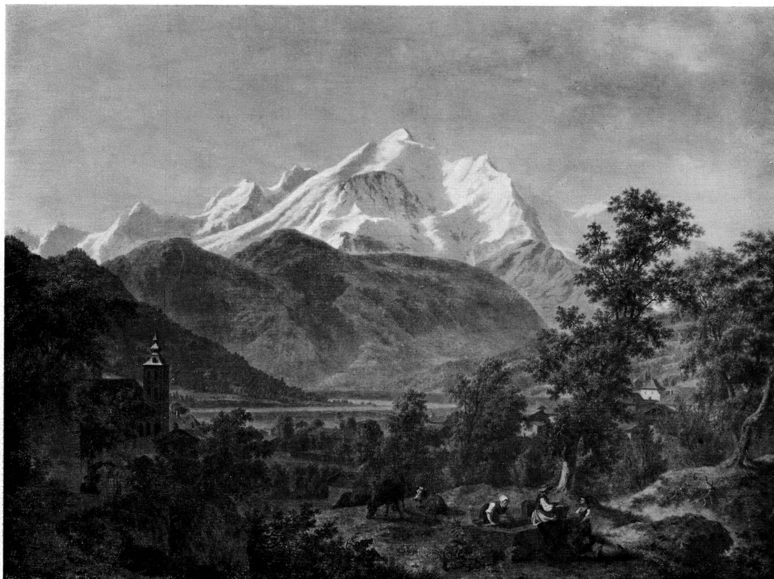
Fig. 3. P. L. DE LA RIVE: Le Mont-Blanc vu de Sallanches .