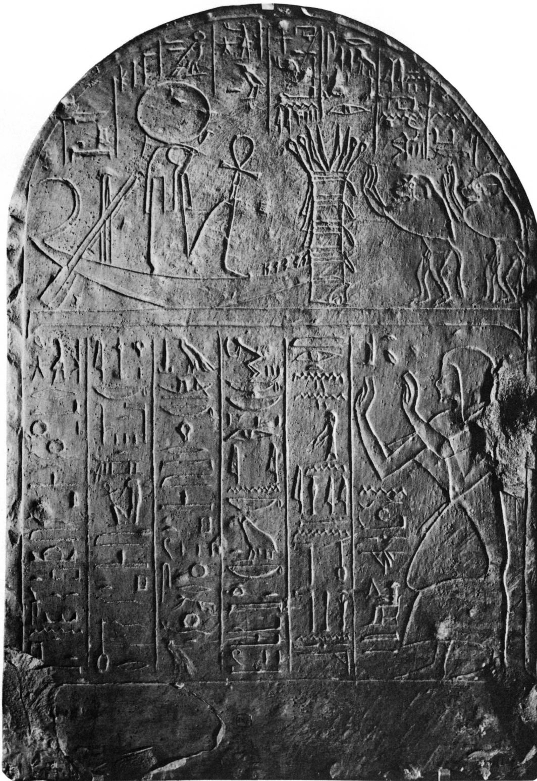
1. La stèle D 47 du Musée d'art et d'histoire de Genève (Photo E. Gaudin).