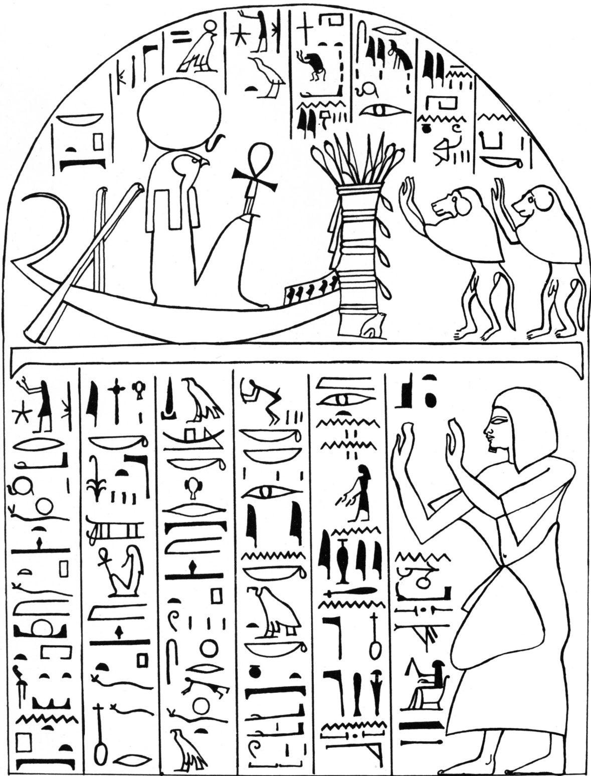
2. Transposition du texte et des figurations de la stèle D 47.