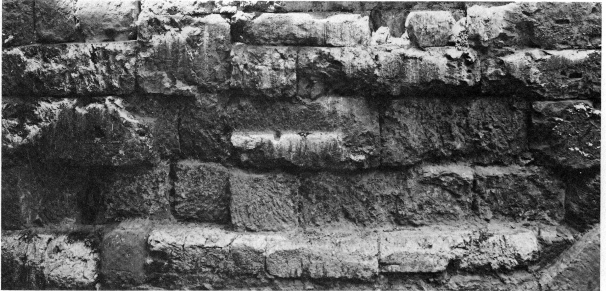
Fig. 3. Le rempart romain, 7, place de la Taconnerie.

7, place de la Taconnerie . Le tracé de l'enceinte correspond ici à celui du mur séparant au sud-est l'immeuble 11 de la rue de l'Hôtel-de-Ville et au nord-ouest l'ensemble qui porte les nos 9 de la même rue et 7 de la place de la Taconnerie. Louis Blondel a reconnu ce tracé dès 1923. Dans la cave du n° 9, dont le niveau est de peu inférieur à celui de la rue, fortement en pente à cet endroit, était encastré un bloc de pierre sculptée. Désireux de l'obtenir, le Musée reçut l'autorisation d'entreprendre des travaux en 1928. Ceux-ci ont été menés dans deux directions: le bloc fut extrait 64 avec vingt autres fragments sculptés présentant un intérêt 65 et, un peu plus loin, le mur d'enceinte fut dégagé sur une douzaine de mètres de longueur, dans le prolongement de la partie extérieure de la tour retrouvée à cette occasion et dont nous venons de parler ci-dessus. Le sol ayant été jadis fortement abaissé ici, cette partie de la muraille antique est soutenue par un soubassement du XVIII e siècle. L'épaisseur de ce rempart est de 2 m 75; mais, comme les blocs ont tous été ravalés à l'extérieur, Blondel pense que la fondation intacte avait au moins 3 m d'épaisseur. La hauteur actuelle de la muraille dépasse 7 m 66 .