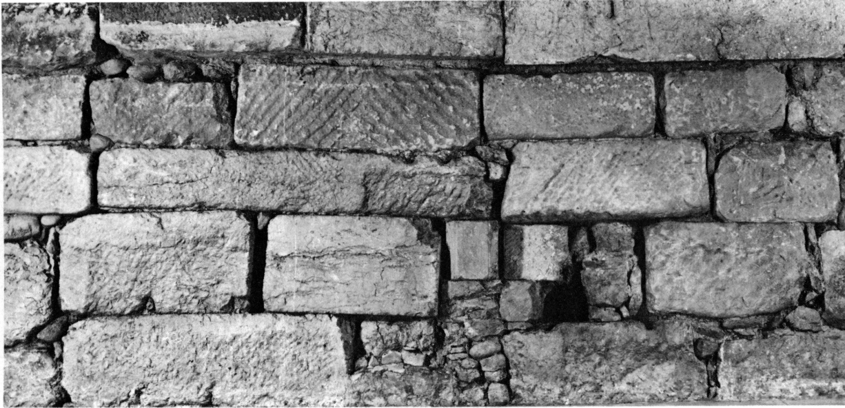
Fig. 4. Le rempart romain, 1, place de la Taconnerie.

a, probablement au moyen âge, beaucoup diminué l'épaisseur de ce mur. Des travaux de terrassement, pratiqués en 1969 en vue de la construction d'un garage privé derrière cet immeuble, ont permis de dégager la face extérieure de l'enceinte antique sur une longueur de 9 m 50 et une hauteur de 2 m 50 à 3 m. On n'a pas trouvé ici de pierres sculptées, mais les blocs portent de nombreuses traces d'une première utilisation. Une nouvelle étude attentive de la cave a révélé la tranchée de destruction laissée par les ouvriers médiévaux, ce qui autorise à fixer la largeur de la muraille à cet endroit entre 2 m 75 et 3 m. La présence de plusieurs ciments oblige à dire que le mur a été élevé en plusieurs étapes 71 . D'autre part, on a découvert, environ 3 m 60 devant le rempart, un autre mur haut de près de 2 m : le terrain étant là en forte déclivité, ce deuxième mur a son sommet conservé au même niveau que le bas de l'enceinte. Son état fragmentaire – on n'a dégagé ce mur que sur une longueur de 2 m 40 – ne permet pas de déterminer son rôle 72 : il faudrait pour cela procéder à des fouilles dans le jardin des immeubles 3 et 5. Quant au segment de l'enceinte proprement dite, qui n'est éloigné du