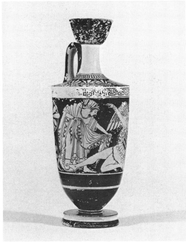
Fig. 4. Lécythe de Genève, inv. 21132: Femme au voile.

découverte récemment à Myrrhinus 29 , offre sur son chiton un antécédent prestigieux. Dans la céramique, le peintre de Kléophradès, au début de sa carrière, utilise plusieurs fois cette sorte de méandre: une kalpis à Rome 30 , un cratère en calice à Tarquinia 31 , une amphore à fond pointu à Berlin 32 . On trouve encore ce méandre sur un fragment de cratère à volutes de Sofia 33 , une péliké archaïque du Louvre 34 et un stamnos à Bâle 35 . Ce dernier vase constitue l'exemple le plus récent, vers 480 av. J.-C.