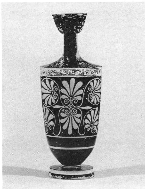
Fig. 1. Lécythe de Genève, inv. 21132: motif floral à l'aplomb de l'anse.

maintes fois dans la céramique à figures noires et plus rarement dans celle à figures rouges 5 . La plus belle et la plus célèbre illustration se trouve sur le tondo d'une coupe du Louvre signée Douris et datant de 490 av. J.-C. 6 . On a vu dans cette image émouvante une Pietà païenne ou une mater dolorosa ; et on a aussi évoqué le génie d'Eschyle 7 . Comme dans les images plus anciennes, Memnon est déjà raidi par la mort, dépouillé de son vêtement et de ses armes. Mais la coupe du Louvre échappe au schéma habituel par le fait que la déesse n'est pas nettement en vol, ce qui est aussi le cas sur le lécythe de Genève. La scène sur le lécythe serait en quelque sorte comme la suite immédiate de celle d'un cratère (à Boston) du peintre de Tyszkiewicz 8 et de celle d'une coupe (à Athènes) signée du potier Gorgos 9 . On y voit Memnon chancelant sous le coup de lance d'Achille, tandis que sa mère accourt derrière lui pour le recevoir dans