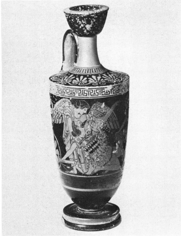
Fig. 3. Lécythe de Genève, inv. 21132: Eos et Memnon.