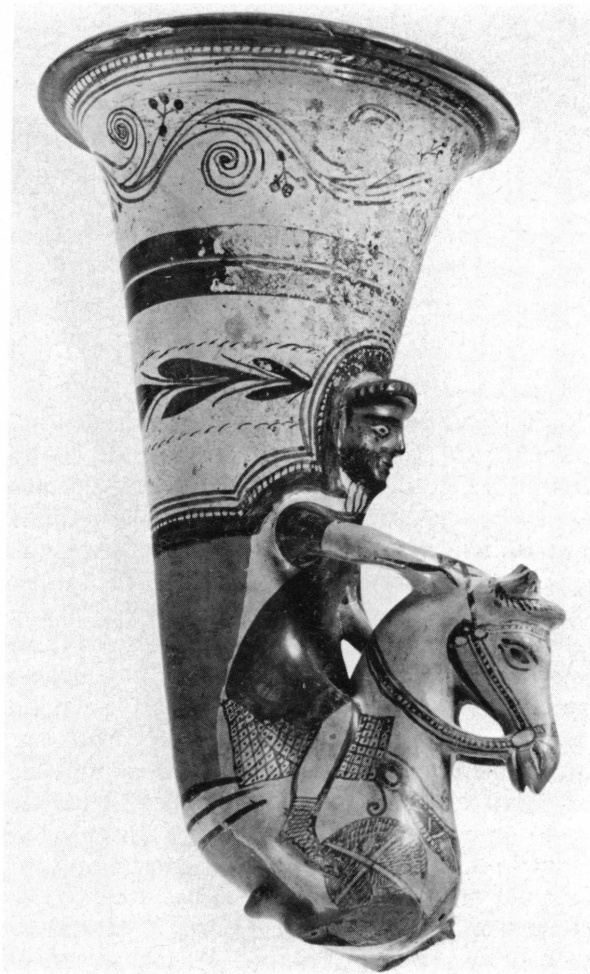
Fig. 1. Rhyton du Musée de Genève.

pupille noire, barre de sourcils noirs, interrompue à la racine du nez, barbe embroussaillée, rendue par des hachures noires, sur le front, coiffure en bourrelet dentelé en relief, du ton de l'argile lustrée; justaucorps blanc à haut col côtelé marqué par des stries rouges, à manches longues et pantalon serré dans des bottines lacées, faites d'une semelle de cuir, rendue en argile lustrée, maintenue par des lacets rouges entrecroisés, à la façon d'espadrilles; tunique rouge, bordée en bas d'un large galon noir, à manches courtes noires, ornées d'un pompon noir se détachant sur la surface blanche de la manche du justaucorps; les mains peintes en noir, la gauche