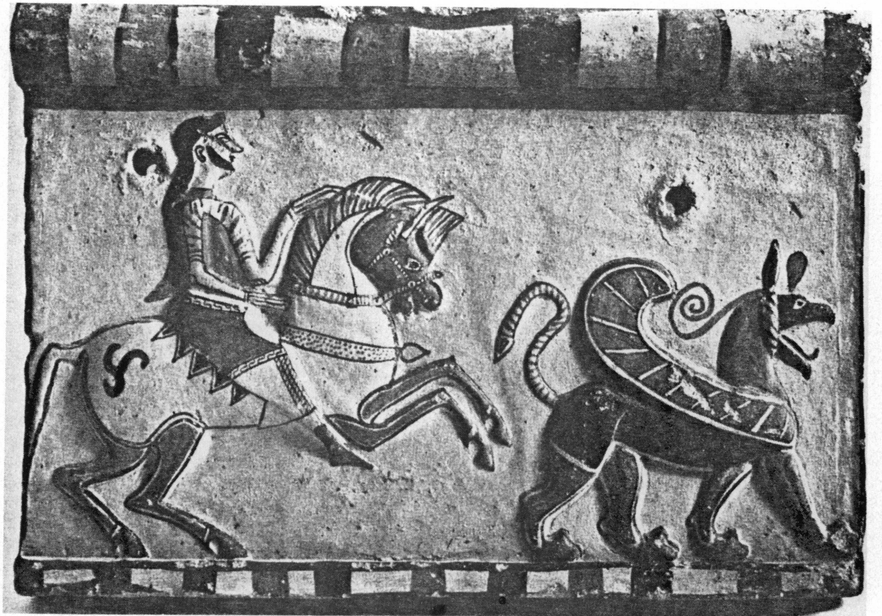
Fig. 4. Plaque de revêtement en terre cuite. Musée d'Israël, Jérusalem.

tres types de représentations figurées qu'il faut se référer pour en trouver des parallèles. Et l'on est immédiatement amené à rapprocher ce cavalier et sa monture de ceux qui ornent les plaques de revêtement architectoniques en terre cuite polychrome du VI e siècle av. J.-C., découvertes à Düver près de Burdur, c'est-à-dire aux confins de la Lydie et de la Phrygie antique 15 . On y voit représentée en relief toujours la même scène: un cavalier caracolant vers la droite précédé d'un griffon ailé.