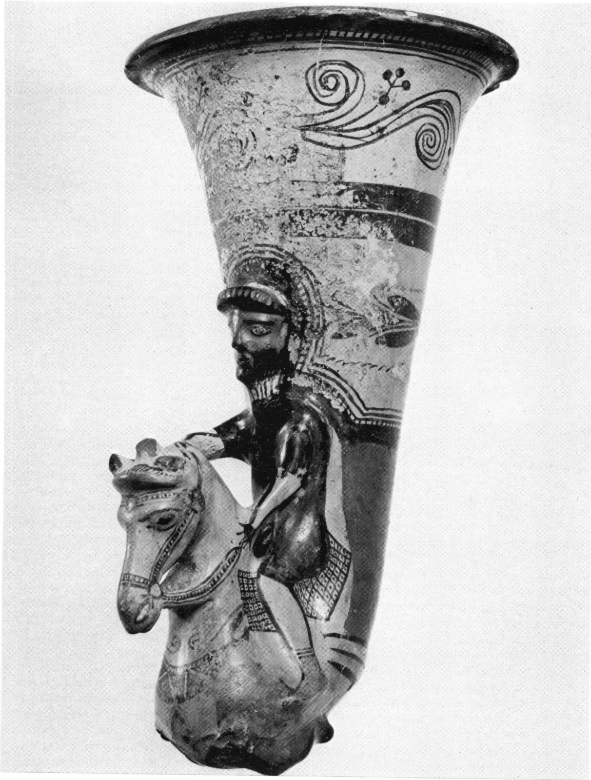
Fig. 2. Rhyton du Musée de Genève.