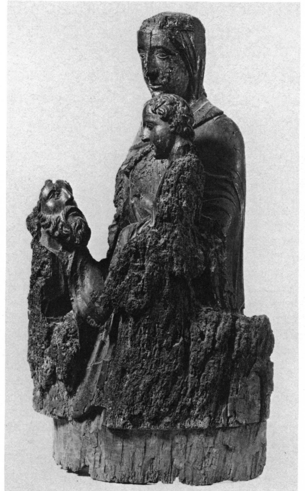
Fig. 2. Vierge de l'Epiphanie, vue de trois quarts à droite.

et le plus âgé des rois mages, agenouillé. Deux autres statues figuraient les autres rois venus adorer l'Enfant et lui offrir des présents. Le groupe central étant sculpté dans une pièce de bois entièrement évidée dans le dos, celui-ci devait avoir été conçu non comme une ronde-bosse, mais comme une statue adossée à une paroi. Les deux rois mages debout étaient soit sculptés en ronde-bosse et placés sur des socles individuels, soit évidés eux-aussi dans le dos et groupés sur un seul socle. Des Epiphanies en bois de la fin du xiv e et du xv e siècles fournissent des exemples de l'une et l'autre possibilités. La façon dont le bois de notre groupe