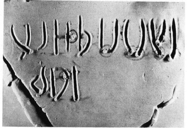
Reconstitution de l'inscription dans le sens «hébraïque».

Dans ce but, nous avons fabriqué des briques d'argile et écrit de nouveau l'inscription au stylet: lorsque nous l'avons écrite dans le sens hébraïque, les traits verticaux ont été tracés évidemment de haut en bas; les dépôts d'argile se trouvaient donc au bas des lettres. Lorsque nous l'avons écrite dans le sens latin, les traits verticaux, tracés de haut en bas, ont laissé sur la brique moderne des dépôts au bas des lettres. Or, sur la brique de Genève, les dépôts se trouvent correspondre à leur place lorsque l'inscription est écrite dans le sens «latin». Cependant, si les dépôts indiquaient bien comment il fallait placer la brique pour lire l'inscription, il restait à trouver le sens de la lecture: droite vers gauche ou gauche vers droite. Or, pour les traits horizontaux, les dépôts se trouvent à gauche, ce qui laisse supposer qu'ils ont été écrits de