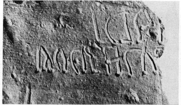
Moulage de la brique.