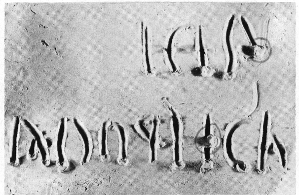
Reconstitution de l'inscription dans le sens «latin».