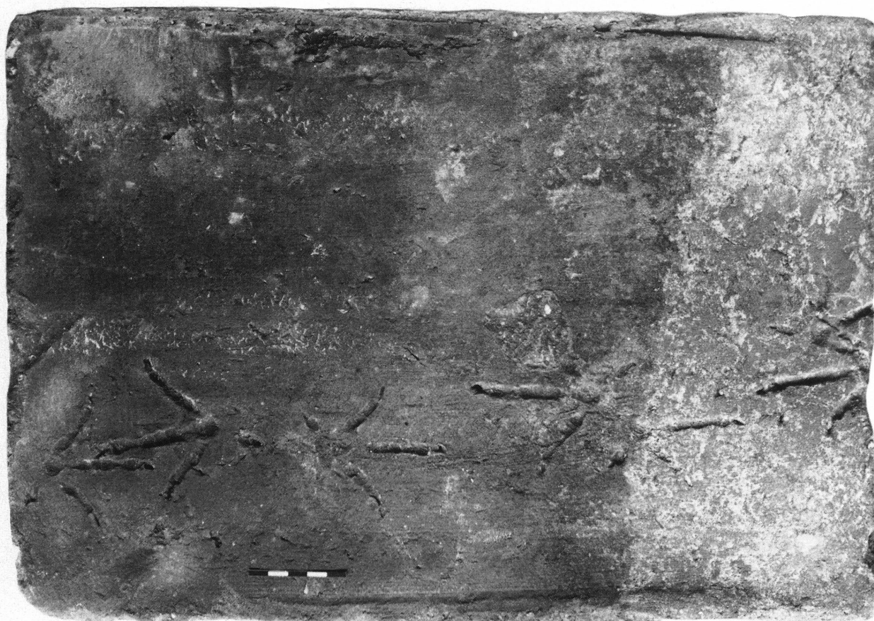
Planche n° 2

Nous n'avons aucun témoin de l'écriture hébraïque telle qu'elle a été écrite dans les régions avoisinant Landecy, au début de l'ère