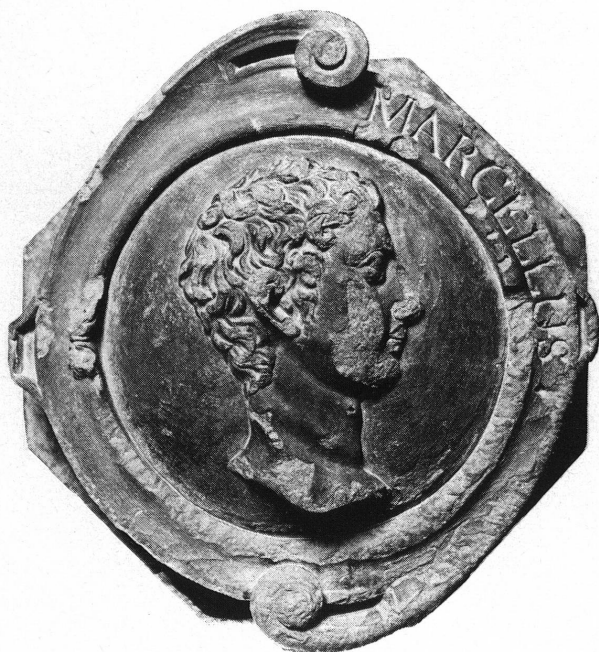
Fig. 8. Marcellus (catalogue n° 9).