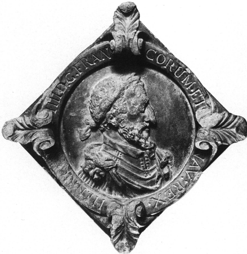
Fig. 6. Henry IV (catalogue n° 11).