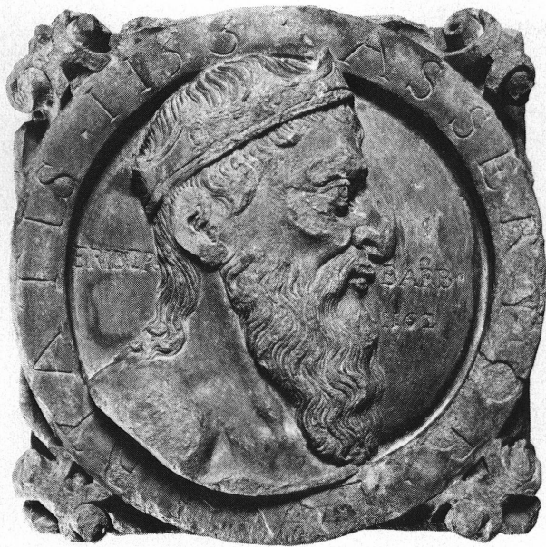
Fig. 4. Frédéric Barberousse (catalogue n° 6).

3. Un carré posé en diagonale, avec encadrement orné de volutes. Dans les angles, têtes d'anges ailés; au centre du carré, une balance.