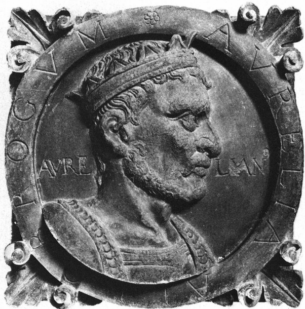
Fig. 5. Aurélien (catalogue n° 8).

6. Dans un carré, médaillon à l'effigie de Frédéric Barberousse; aux quatre angles, des volutes. Légende circulaire: ASSERTOR LIBERTATIS. 1153. A gauche du buste: FRIDER, à droite: BARB. 1162. Tête de profil couronnée. Dimensions 37 × 37 × 16 cm. Musée d'art et d'histoire. Inv. 1979-58 (fig. 4).