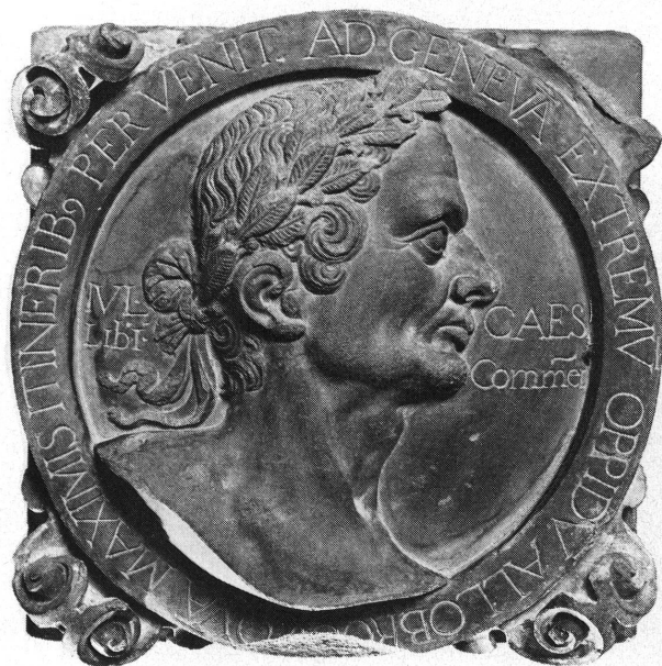
Fig. 3. Jules César (catalogue n° 5).

Le portail fait face à un bâtiment de plan rectangulaire, parallèle à la rue de l'Hôtel de Ville et qui forme le côté nord-est de la cour. Le rez-de-chaussée de ce bâtiment a deux accès sur la rue et est conçu comme un corps de portique, halle d'entrée rythmée par dix colonnes toscanes portant des arcs en anse de panier et des voûtes sur croisées d'ogives. Ce portique se prolonge à angle droit par deux autres travées qui le relient au portail s'ouvrant sur la rampe (fig. 2).