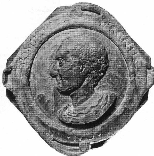
Fig. 9. Pompée (catalogue n° 10).

11. Dans un carré posé en diagonale, médaillon à l'effigie de Henri IV; volutes ornées de feuilles aux quatre angles, interrompant la légende circulaire: HENRICUS IIII.D.G. FRANCORUM. ET.NAV: REX. Tête de profil couronnée de lauriers. Dimensions 37,5 × 37,5 × 17 cm. Musée d'art et d'histoire. Inv. 1979-63 (fig. 6).