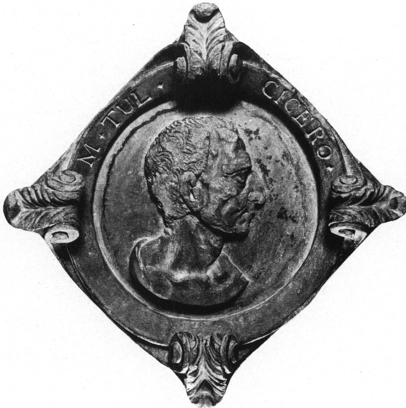
Fig. 7. Cicéron (catalogue n° 12).