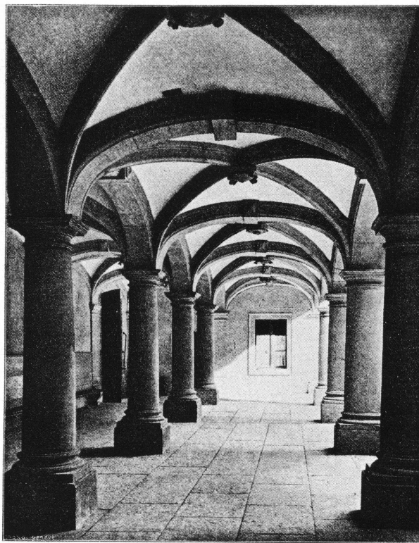
Fig. 2. Portique de la Maison de Ville (état vers 1906).