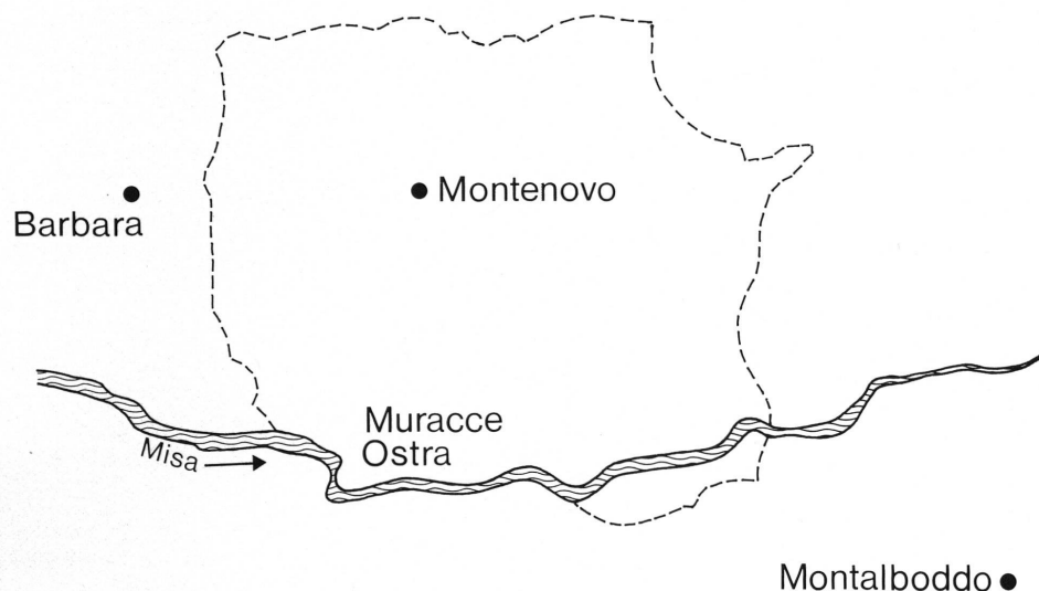
3. Plan de la commune de Montenovo, maintenant Ostra Vetere.