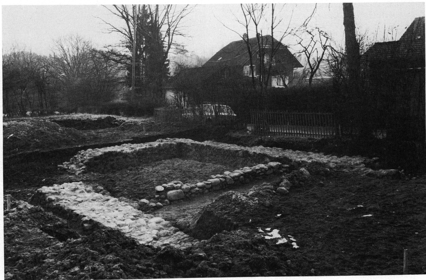
3. Vue des fondations de la chapelle.