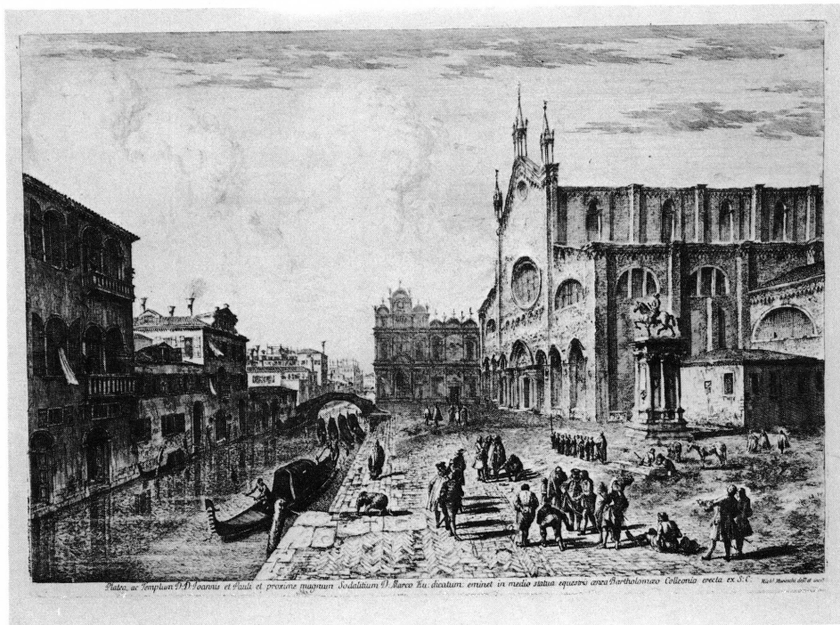
3. Le Campo SS. Giovanni e Paolo.