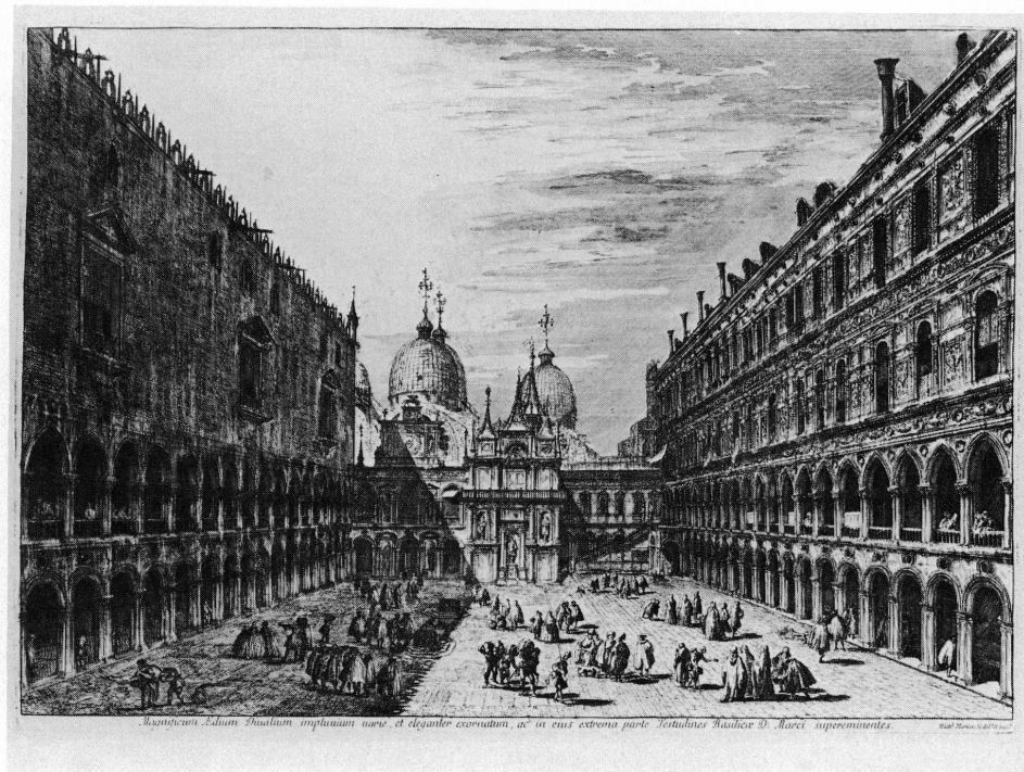
2. La cour du Palais ducal.