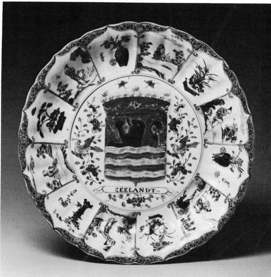
5. Musée Ariana, Genève, Inv. AR 3640.

individuelles. Rien de précis ne peut être opposé à cette explication qui a l'avantage de la simplicité. Il demeure étonnant que ces nombreux plats n'aient été utilisés par les commanditaires hollandais que pour des armoiries de collectivités et jamais pour des armoiries individuelles. N'est-il pas curieux aussi que la France et l'Angleterre soient les seuls pays étrangers mentionnés?