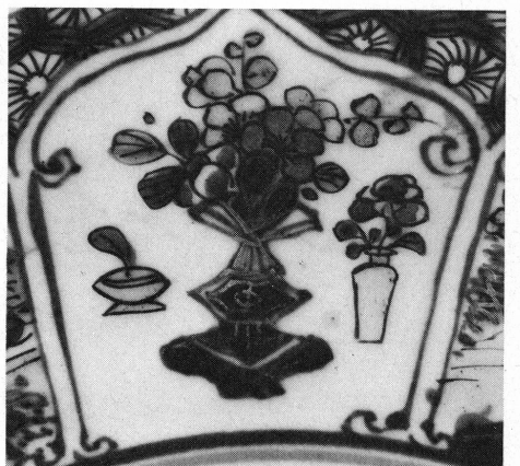
13 à 15. Musée Ariana, Genève, Inv. AR 3641, détails.