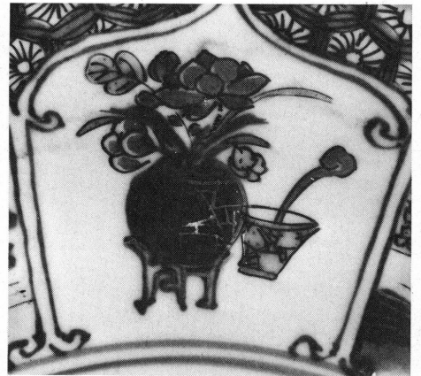
10 à 12. Musée Ariana, Genève, Inv. AR 3641, détails.