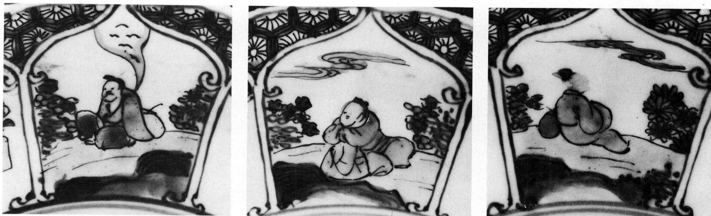
19 à 21. Musée Ariana, Genève, Inv. AR 3641, détails.

XVIII e siècle, n'être plus que des motifs traditionnels de valeur décorative.