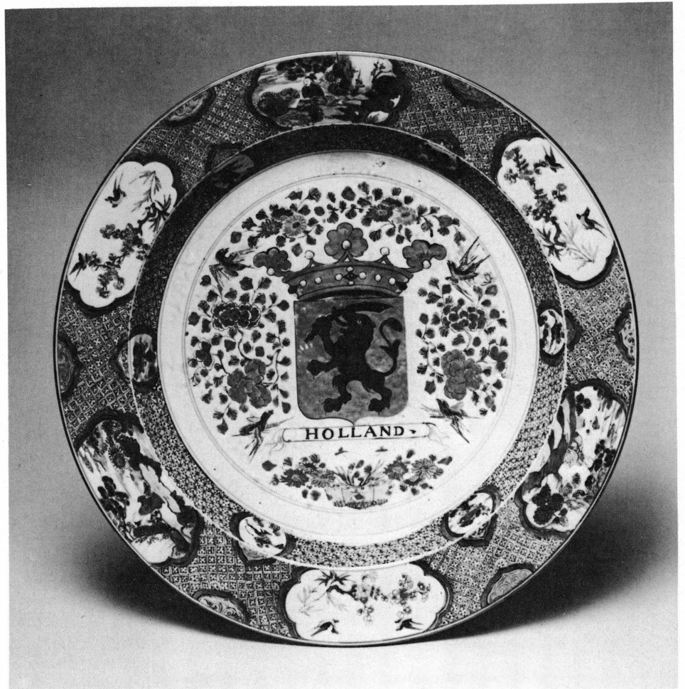
6. Musée Ariana, Genève, Inv. AR 3639.

demi-médailles décoratifs — six grandes réserves représentant d'une part trois personnages assis dans un paysage et d'autre part trois compositions de bambou et prunier, survolés par deux oiseaux.