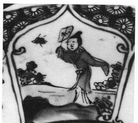
16 à 18. Musée Ariana, Genève, Inv. AR 3641, détails.