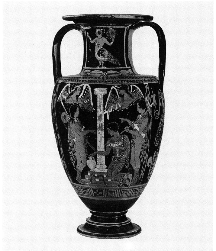
1. Cratère apulien. Vers 350 avant J.-C. haut. 74 cm.

Le musée de Genève possède une belle collection de portraits antiques. C'est dans le dessein de la compléter et de la diversifier que l'association a acquis un portrait de magistrat romain du I er siècle de notre ère, provenant de Syrie (à l'époque où Ponce Pilate était procurateur de Judée, sous le contrôle du légat en Syrie). Il s'agit d'une tête de calcaire un peu fruste, mais expressive.