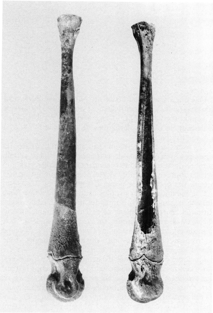
1. Ebauche de poinçon préparée à partir d'un métacarpien de jeune chèvre.