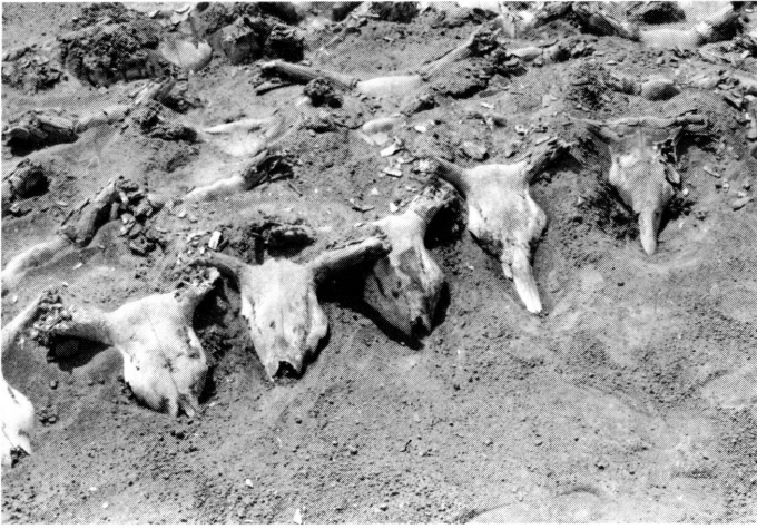
2. Bucranes de bovidés de la tombe 115. On peut noter les deux types de découpe, la plus ancienne conservant les nasaux alors que plus tard, ils sont sectionnés au niveau de l'épine nasale.