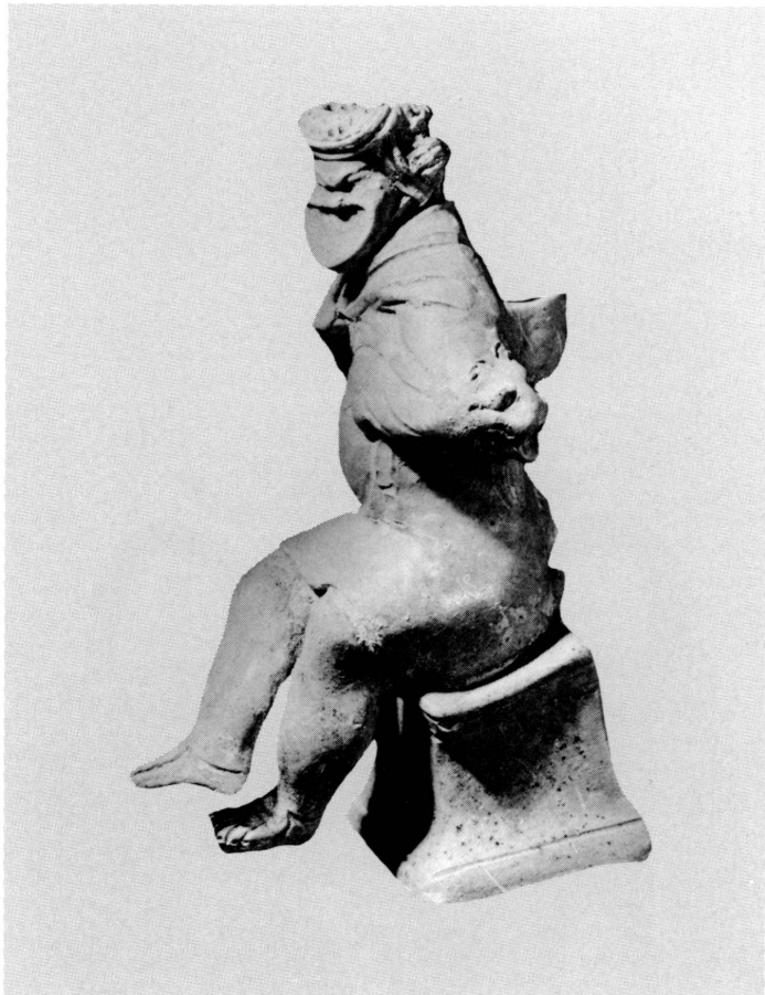
2. Vase en forme de statuette polychrome représentant un acteur comique dans le rôle d'un esclave réfugié sur un autel. Groupe dit de Magenta. Italie méridionale. IV/III e siècle avant J.-C. Œuvre rarissime: la seule pièce comparable est exposée au British Museum. Haut. 13 cm. Acquisition.